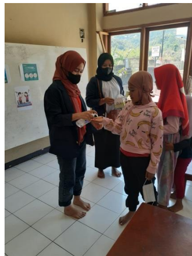
Gambar 2. Pembagian Handsanitizer

Kegiatan pelatihan pembuatan disinfektan sederhana kepada masyarakat di Desa Pasir Luhur RT 01/RW 10, Kelurahan Cisurupan, Kecamatan Cibiru, Kota Bandung dilakukan terkait pencegahan penularan virus Covid-19. Berdasarkan observasi, diketahui bahwa wilayah tersebut secara umum termasuk zona hijau, namun antisipasi terhadap Covid-19 tetap perlu dilakukan mengingat kasus angka kematian akibat Covid-19 yang masih terus meningkat.