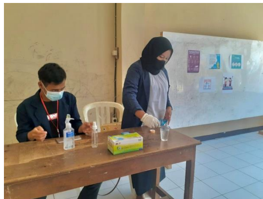
Gambar 4. Demonstrasi Pembuatan Disinfektan Sederhana

Kegiatan ini dilaksanakan secara tatap muka. Setelah dilakukan observasi awal, sosialisasi kegiatan pelatihan dilakukan secara langsung kepada masyarakat dengan tetap memperhatikan protokol kesehatan. Pada kegiatan ini menggunakan media pamflet untuk memberikan pengetahuan kepada masyarakat mengenai berbagai hal dalam pencegahan penularan Covid-19.