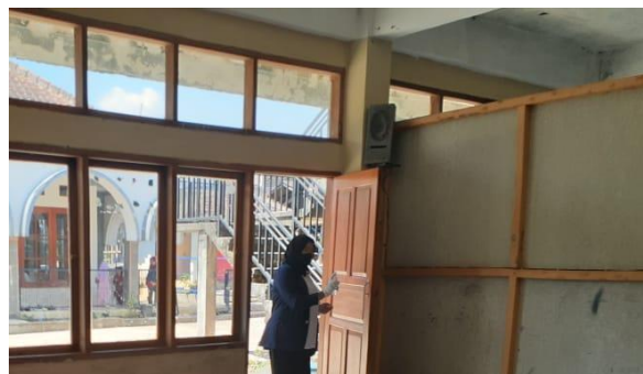
Gambar 7. Penyemprotan Disinfektan

Dari beberapa penelitian, penggunaan disinfektan ini efektif untuk membunuh virus jika disertai dengan pembatasan jarak dengan penderita. Perilaku individu dan aturan umum sangat penting untuk mengendalikan penyebaran dari Covid-19.