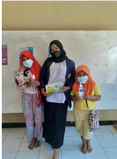
Gambar 8. Hasil Pelatihan

dapat berfungsi untuk mengendalikan, mencegah, bahkan menghancurkan mikroorganisme berbahaya (Suryandari & Haidarravy, 2020).