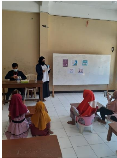
Gambar 3. Penyuluhan Pencegahan Covid-19

Kegiatan ini dilaksanakan secara tatap muka. Setelah dilakukan observasi awal, sosialisasi kegiatan pelatihan dilakukan secara langsung kepada masyarakat dengan tetap memperhatikan protokol kesehatan. Pada kegiatan ini menggunakan media pamflet untuk memberikan pengetahuan kepada masyarakat mengenai berbagai hal dalam pencegahan penularan Covid-19.