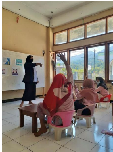
Gambar 6. Antusias Anak-Anak

mencoba cara membuat disinfektan sederhana dengan alat dan bahan yang telah disediakan.