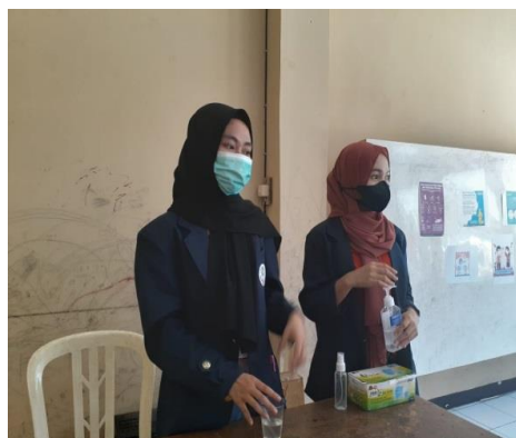
Gambar 5. Cara Penggunaan Handsanitizer

Pengayaan masker, handsanitizer, dan pembuatan disinfektan sederhana menunjukkan bahwa masyarakat Desa Pasir Luhur RT 01/RW 10 sadar akan dampak bahaya yang ditimbulkan akibat penyebaran virus Covid-19 sehingga masyarakat Desa Pasir Luhur RT 01/RW 10 berkerjasama dalam upaya pencegahan guna memutus rantai penyebaran penularan Covid-19.