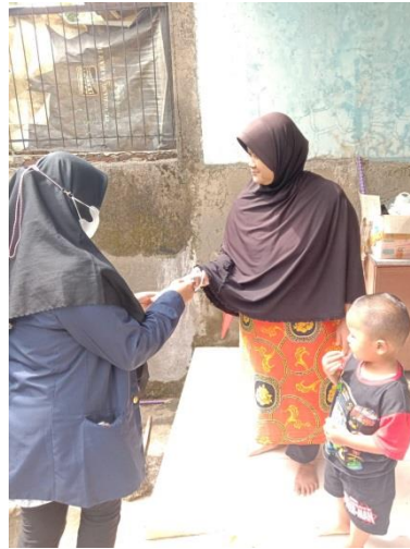
Gambar 1. Pembagian Masker