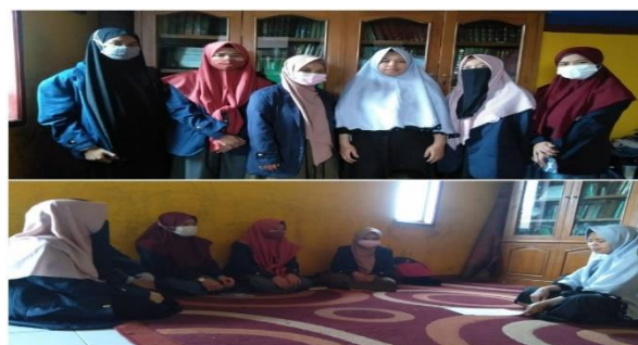
Gambar 2. Perizinan KKN DR