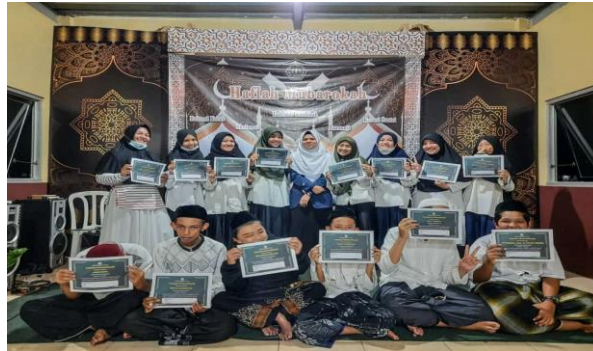
Gambar 12. Pembagian Sertifikat

berprestasi, sertifikat ini juga sebagai saksi bisu bahwa mereka pernah hafal tashrifan, sebagai modal awal untuk membaca kitab gundul.