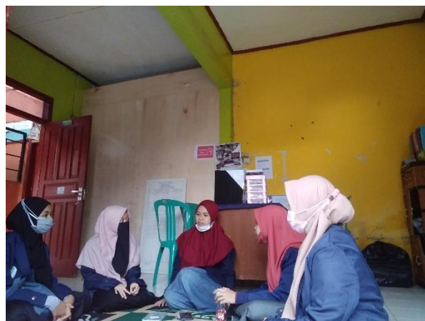
Gambar 4. Perencanaan Program Kegiatan

Setelah mendengarkan masalah yang dihadapi oleh para santri. Kami membuat perencanaan guna mengatasi masalah yang mereka hadapi.