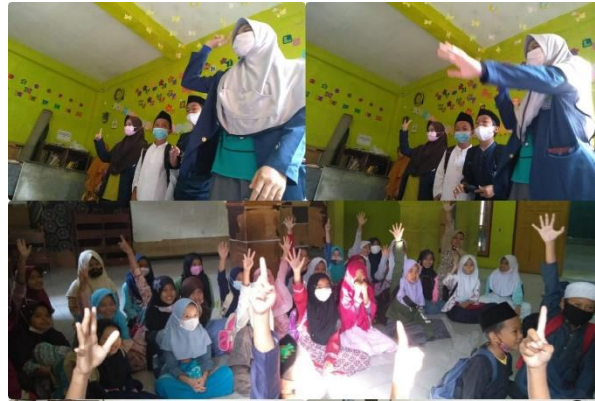
Gambar 3. Sosialisasi