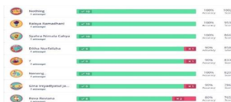
Gambar 11. Post tes menggunakan Quizizz