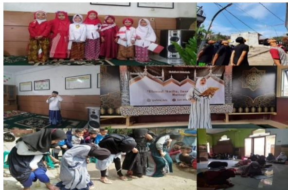
Gambar 10. Perlombaan 17 Agustus

Masih dalam memeriahkan peringatan HUT RI, perlombaan berlangsung setelah upacara dilaksanakan, mulai dari makan kerupuk, baca puisi, fashion show, menggambar, dan lain-lain. Acara dapat dilaksanakan atas kerjasama peserta KKN dan pengurus Pondok Pesantren.