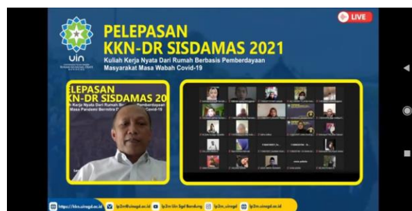
Gambar 1. Pelepasan KKN DR