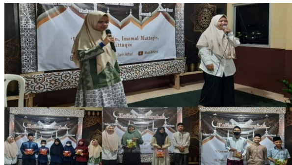
Gambar 13. Penutupan kegiatan & pembagian Hadiah

Kegiatan KKN di PONPES Miftahuttaufiq diakhiri dengan pengumuman kejuaraan lomba yang telah dilaksanakan sekaligus pembagian hadiah. Tujuan diadakannya lomba selain untuk menumbuhkan rasa nasionalisme juga untuk mencari minat dan bakat yang selama ini orang lain tidak banyak mengetahuinya.