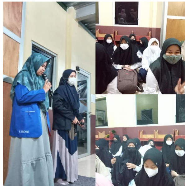
Gambar 5. Pembukaan KKN