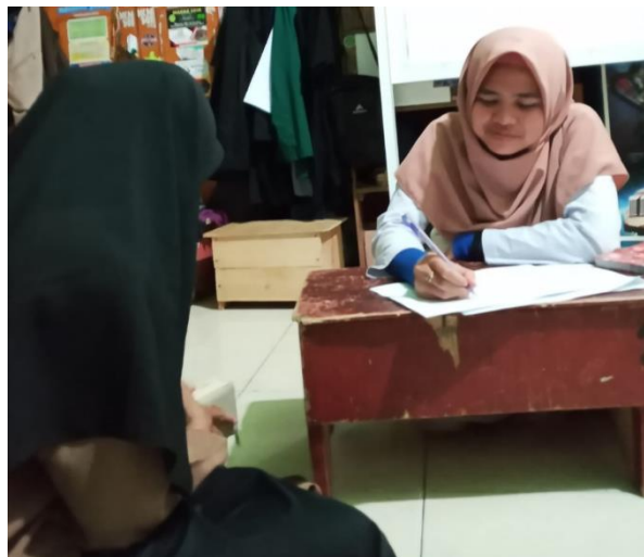
Gambar 8. Setoran Tashrifan

Pelaksanaan program terhitung mulai dari tanggal 9 Agustus 2021, mereka menghafal dengan cara setiap santri setoran 2 Bab Tashrifan, lengkap dengan wazan dan mauzunnya.