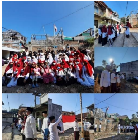
Gambar 9. Upacara peringatan HUT RI ke-76