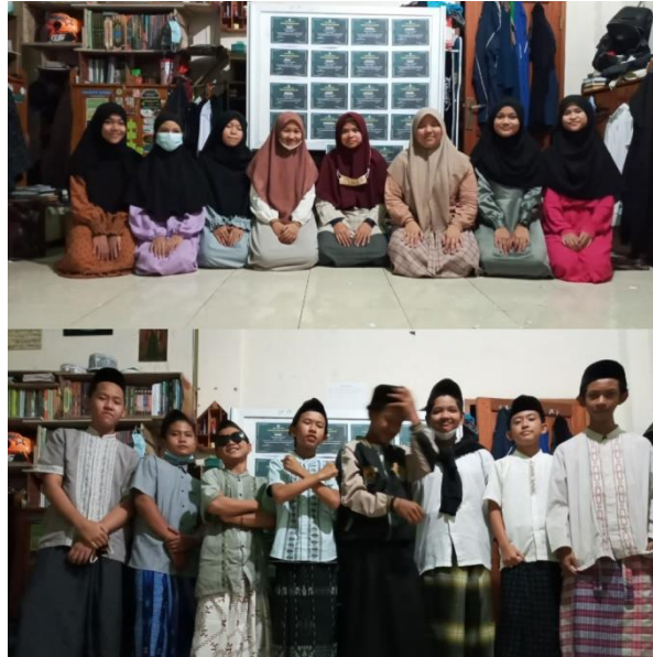
Gambar 7. Pemberian sertifikat sebagai motivasi diawal kegiatan