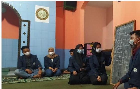
Gambar 10. Pemaparan Program Oleh Mahasiswa

wanita, tokoh pemuda. Kemudian forum tersebut membahas sinergi program yang memungkinkan kegiatan tersebut dapat masuk pada agenda mesyuarah perencanaan pembangunan desa (musrenbangdes) pada setiap Bulan Januari dan atau memungkinkan dapat melakukan channeling dengan pihak-pihak swasta atau pengusaha yang ada disekitar desa tersebut. Selain itu, forum tersebut menetapkan angka partisipasi swadaya masyarakat baik dalam bentuk tenaga, bahan material atau uang tunai yang dikapitalisasi.