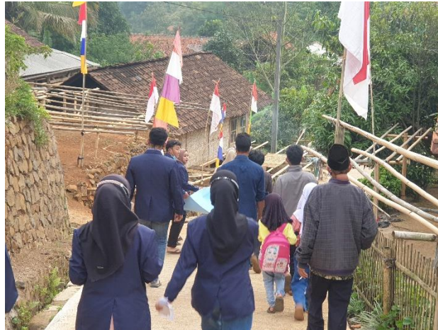
Gambar 7. Menjelajah Kampung Untuk Menggambar Peta

Organisasi ini diharapkan menjadi motor penggerak bagi masyarakat yang kemudian membentuk kelompok-kelompok kerja (Pokja) ditingkat basis/ RT/ Komunitas sebagai pelaksana kegiatan pemberdayaan masyarakat. Pokja sebagai representasi kelompok swadaya masyarakat adalah kelompok sosial pada tingkat akar rumput, yang mempunyai kegiatan-kegiatan sosial kemasyarakatan, ekonomi dan pemeliharaan lingkungan. Dalam praktek ini diharapkan warga dapat terlibat dan menerima manfaat dari kelompok ini, dengan cara menjadi anggotanya dan diperlakukan adil seperti anggota masyarakat yang lainnya.