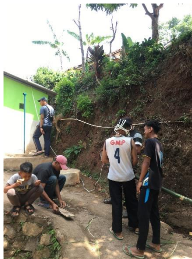
Gambar 11. Pemasangan Lampu Dengan Warga Setempat