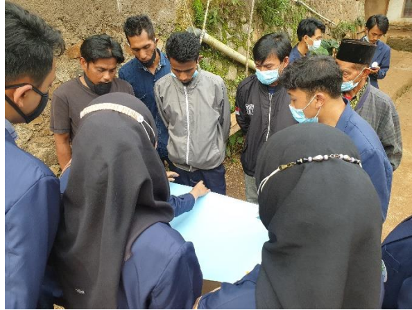
Gambar 6. Menggambar Peta RW 02 Bersama Warga

Siklus ini merupakan jawaban dari kebutuhan masyarakat terhadap adanya organisasi masyarakat warga yang mampu menerapkan nilai-nilai luhur yang dimotori oleh pemimpin yang mempunyai kriteria yang sudah ditetapkan oleh masyarakat sebagai jawaban dari hasil analisa/observasi kelembagaan dan refleksi kepemimpinan yang sudah dilaksanakan dalam siklus Pemetaan Sosial. Organisasi masyarakat warga yang dibangun bisa bersifat organik berbentuk paguyuban atau perhimpunan atau memanfaatkan organisasi atau lembaga yang sudah ada di masyarakat seperti Lembaga Pemberdayaan Masyarakat Desa (LPMD), Majelis Ulama Indonesia (MUI), Dewan Kemakmuran Masjid (DKM), Pembina Kesejahteraan Keluarga (PKK), Karang Taruna dll selama dalam organisasi tersebut mempunyai ciri-ciri :