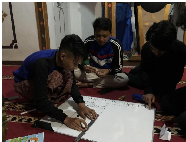
Gambar 12. Pembuatan Tabel Papan Informasi

Kegiatan dimulai dengan sosialisasi baik secara lisan dan tulisan. Secara lisan dapat dilakukan secara face to face atau melalui pengumuman pengeras suara milik masyarakat seperti dari masjid atau mushala dengan oleh tokoh masyarakat dan atas persetujuan bersama.