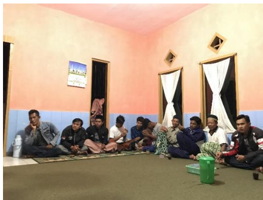
Gambar 8. Tamu Undangan Pada Kegiatan Cantif