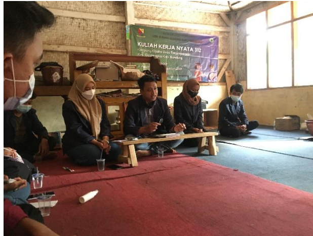
Gambar 5. Penjelasan Pemetaan Sosial Oleh Mahasiswa

Pemetaan sosial (social mapping) didefinisikan sebagai proses penggambaran masyarakat yang sistematis serta melibatkan pengumpulan data dan informasi mengenai masyarakat termasuk di dalamnya profil dan masalah sosial yang ada pada masyarakat tersebut. Merujuk pada Netting, Kettner dan McMurtry (1993), pemetaan sosial dapat disebut juga sebagai social profiling atau "pembuatan profile suatu masyarakat. Pemetaan sosial dapat dipandang sebagai salah satu pendekatan dalam Pengembangan Masyarakat yang oleh Twelvetrees (1991:1) didefinisikan sebagai "the process of assisting ordinary people to improve their own communities by undertaking collective actions." Sebagai sebuah pendekatan, pemetaan sosial sangat dipengaruhi oleh ilmu penelitian sosial dan geografi. Salah satu bentuk atau hasil akhir pemetaan sosial biasanya berupa suatu peta wilayah yang sudah diformat sedemikian rupa sehingga menghasilkan suatu image mengenai pemusatan karakteristik masyarakat atau masalah sosial, misalnya jumlah orang miskin, rumah kumuh, anak terlantar, yang ditandai dengan warna tertentu sesuai dengan tingkatan pemusatannya.