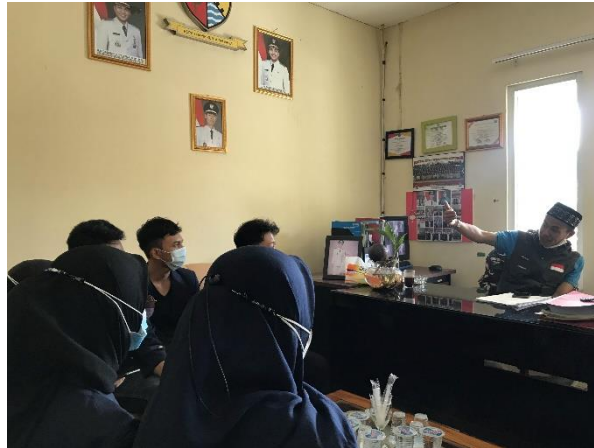
Gambar 1. Pertemuan Dengan Kepala Desa

Selain itu, persiapan dapat juga melahirkan suatu kepercayaan (trust), keterbukaan dan suasana akrab di antara masyarakat dan Dosen Pembimbing Lapangan serta praktikan. Salah satu tahap dalam sosialisasi adalah penyusunan rencana kegiatan sosialisasi konsep kuliah kerja nyata. Dalam rencana tersebut menyangkut tentang kesepakatan mengenai :