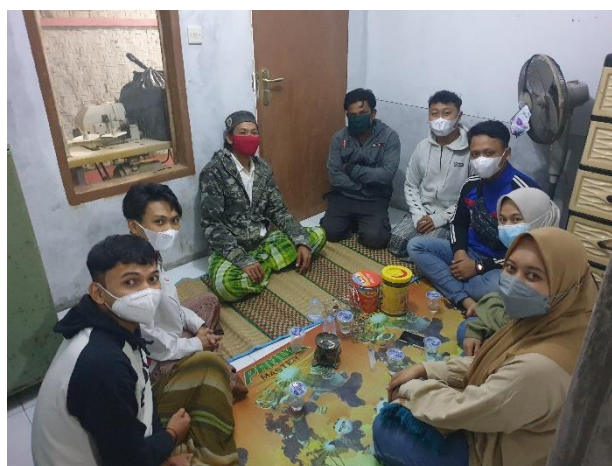
Gambar 2. Pertemuan Dengan Ketua RW 2 dan RT 1