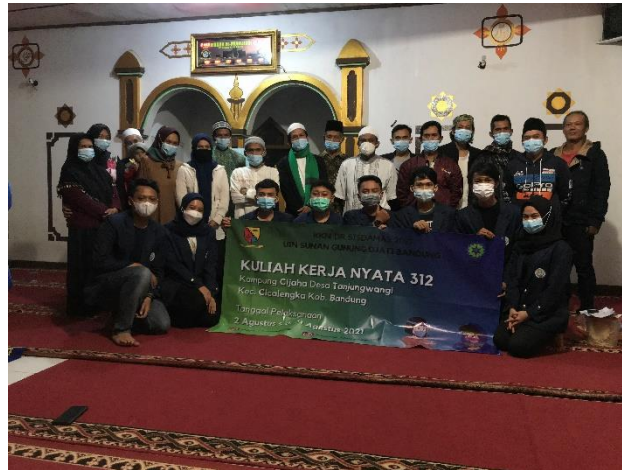
Gambar 4. Foto Bersama Selesai Acara Rembug Warga

Proses olah pikir dan olah rasa ini dapat dilakukan dengan Focus Group Discussion (FGD) atau Diskusi Kelompok Terarah (DKT) ditingkat basis atau komunitas yang dipandu oleh duta pemberdayaan atau relawan tingkat basis. Diskusi Kelompok Terarah (DKT) dilakukan secara paralel pada saat rembug warga atau tersendiri bersama masyarakat tingkat basis.