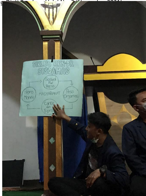
Gambar 3. Penjelasan Siklus KKN Sisdamas

Sebagaimana sosialisasi awal & rebug warga ditingkat desa, pada tingkat RW dan RT serta komunitas tinggal melanjutkan sosialisasi dengan berbagai media sosialisasi yang ada di masyarakat. Berita acara, daftar hadir dan dokumen hasil penyepakatan diperbanyak oleh relawan disetiap RW, RT dan komunitas. Setelah kegiatan ini selesai, pemandu menawarkan kepada peserta untuk menyusun rencana kerja tindak lanjut kepada masyarakat secara tertulis dalam Berita Acara.