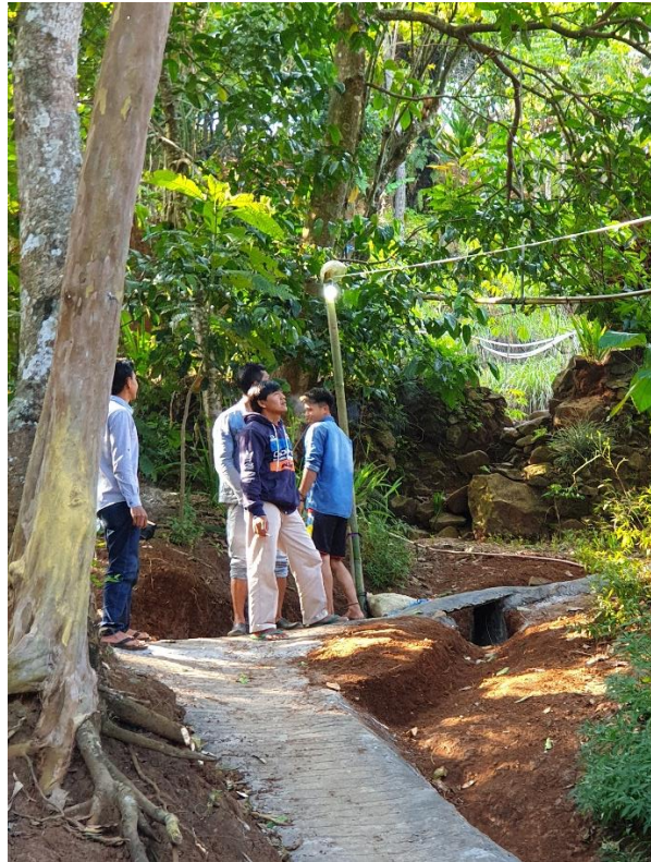
Gambar 13. Hasil Uji Coba Pemasangan Lampu

masyarakat Kampung Cijaha bisa lebih mengoptimalkan pekerjaan atau kegiatan sehari-harinya, sehingga mampu meningkatkan taraf hidup masyarakatnya.