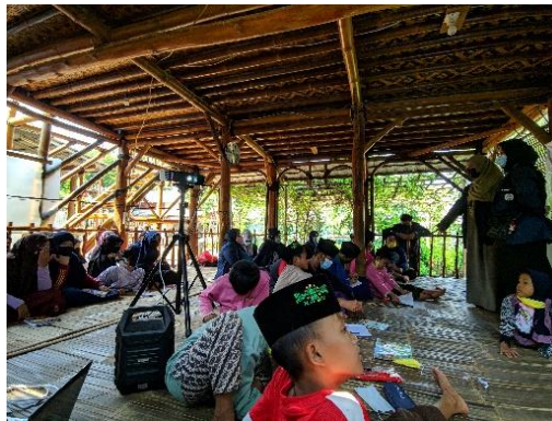
Gambar 2. Pembelajaran Sejarah Islam