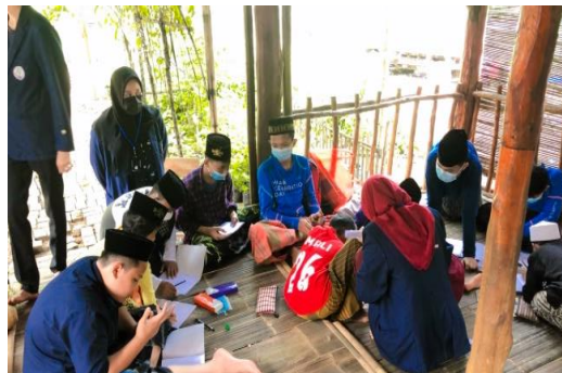
Gambar 3. Pembelajaran Sejarah Indonesia