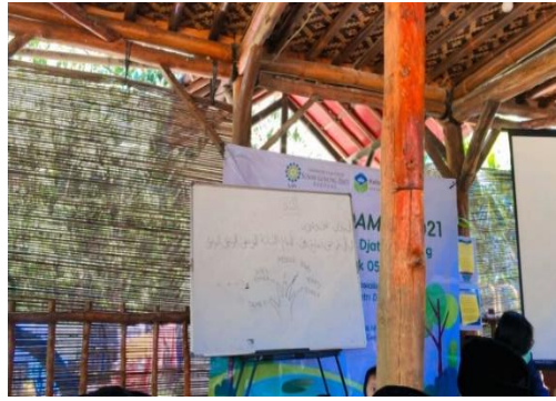
Gambar 1. Pembelajaran Muhadatsah