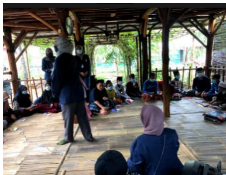
Gambar 1. Pembelajaran Bahasa

Kemudian, di akhir pembelajaran Bahasa santri diberikan kegiatan post-test sebagai evaluasi atau penilaian oleh mahasiswa dalam berbentuk tanya jawab secara langsung untuk mengukur pemahaman dan daya ingat santri atas kosa kata Bahasa yang telah kami ajarkan kepada mereka, yang diharapkan kosa kata tersebut bisa terus diingat oleh santri dan bisa mengembangkan lagi pemahaman kosa katanya.