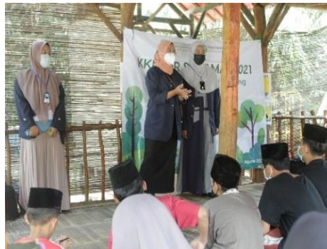
Gambar 2. Pembelajaran Sejarah Islam

Penyampaian materi pembelajaran sejarah islam ini di awali dengan para santri diberikan tayangan video pembahasan mengenai Sejarah Islam. Kemudian santri diberikan waktu untuk memperhatikan video yang diputar, setelah penayangan video pembelajaran dilakukan post-test berupa tanya jawab untuk mengukur pemahaman dan konsentrasi santri terhadap materi yang diberikan.