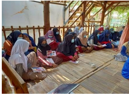
Gambar 3. Pengajaran Sejarah Indonesia

Indonesia. Santri diberikan waktu untuk memperhatikan video yang diputar. Kemudian, di akhir pembelajaran santri diberikan post-test atau sebagai bahan evaluasi kegiatan dalam bentuk beberapa soal mudah yang dijawab secara langsung untuk mengukur pemahaman, dan pengetahuan yang telah berikan