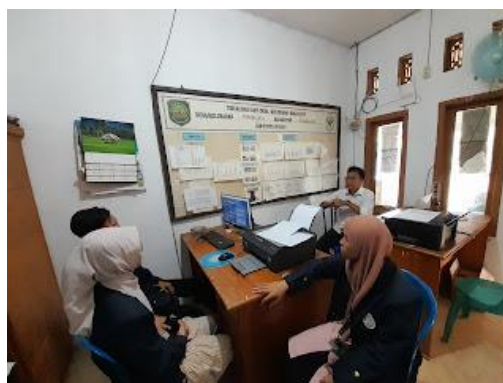
Gambar 2. Mahasiswa dan Pemerintah Desa sedang berdiskusi di Kantor Desa Pusakajaya

Kegiatan pendataan sertifikasi halal kepada pelaku UMKM dilakukan juga dilakukan dengan mensosialisasikan sertifikasi halal. Sosialisasi dilakukan serentak dengan pendataan dengan mendatangi seluruh UMKM yang ada di Dusun Mekarjati. Sosialisasi ini diawali dengan mengajukan beberapa pertanyaan terkait produk yang dijual serta menanyakan mengenai keyakinan para pelaku UMKM mengenai kehalalan dari produk yang dijual. Pertanyaan selanjutnya mengarah pada pemahaman pelaku UMKM terhadap proses sertifikasi halal dimulai dari menanyakan apakah responden sudah memiliki sertifikasi halal untuk produknya, menanyakan mengenai lembaga mana yang mengeluarkan sertifikasi halal, dan prosedural untuk mengajukan sertifikasi halal. Hal ini ditujukan untuk melihat pemahaman dasar pelaku UMKM terhadap sertifikasi halal, terutama dari segi kelembagaan dan administratif.