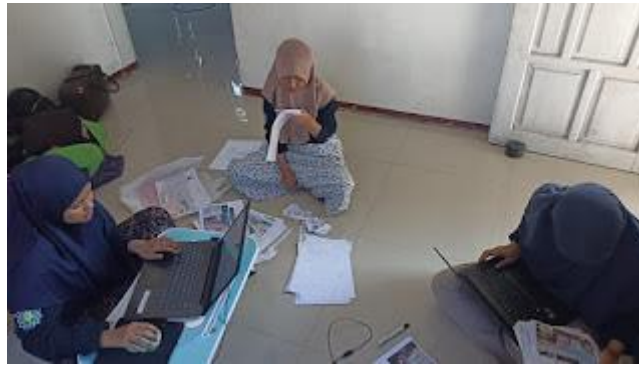
Gambar 1. Mahasiswa mencatat Sertifikasi Halal UMKM

Kegiatan sertifikasi halal UMKM terhadap masyarakat Desa Pusakajaya terkhususnya Dusun Mekarjati bertujuan untuk mengetahui penyebaran makanan yang tersebar di wilayah Dusun Mekarjati sehingga dapat ditentukan jumlah sampling dari UMKM makanan yang halal dan non-halal. Kegiatan observasi ini dilakukan dengan menyisir seluruh UMKM yang ada di Dusun Mekarjati.