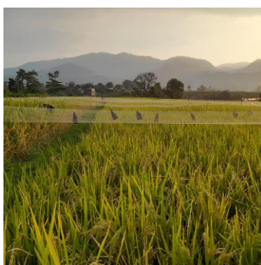
Gambar 4. Jaring yang sudah terpasang pada areal persawahan

Tahapan pelaksanaan dilakukan dengan mengumpulkan alat dan bahan yang sudah disiapkan. Alat dan bahan yang digunakan terdiri dari jaring, tali tambang, ajir, dan gunting/alat pemotong lainnya. Pemasangan jaring diawali dengan memasukan tali tambang pada tepi jaring sebagai pengikat jaring pada ajir. Kemudian, pada setiap ujung jaring yang sudah diikatkan pada ajir ditancapkan dititik awal yaitu dibagian hulu sawah. Jaring dibentangkan di atas permukaan tanaman padi hingga mencapai titik akhir yaitu bagian hilir sawah. Jaring dipasang pada seluruh areal persawahan (Gambar 4) yang sudah dihitung luas lahannya. Pada bagian tengah pada kedua sisi jaring juga diikatkan pada ajir agar jaring dapat berdiri dengan kokoh dan tidak terlalu dekat dengan padi. Pemasangan jaring dilakukan pada saat tanaman berumur 75 HST (Hari Setelah Tanam).