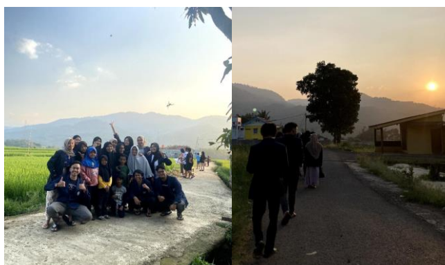
Gambar 1. Survei lokasi dan observasi di Kampung Tinggarjaya Hilir

Tahap persiapan menjadi langkah awal dalam pelaksanaan kegiatan, tahapan ini terdiri dari survei lokasi, wawancara, identifikasi masalah, dan perencanaan. Survei lokasi dilakukan pada minggu pertama yang didampingi oleh Ketua RT. 01 dan Ketua RT. 02 dapat dilihat pada Gambar 1. Survei ini bertujuan untuk mengobservasi keadaan lingkungan tempat tinggal selama pelaksanaan KKN. Posko KKN menjadi titik awal lokasi survei dan lokasi terakhir yaitu bertempat di perbatasan antara RW. 01 dan Kampung Peuris.