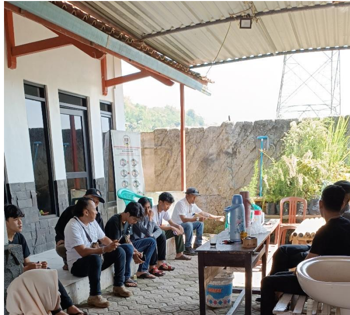
Gambar 2. Proses Observasi untuk Pembuatan Video Profil

Pada hari berikutnya, kami melakukan observasi kepada Desa Cikadu.