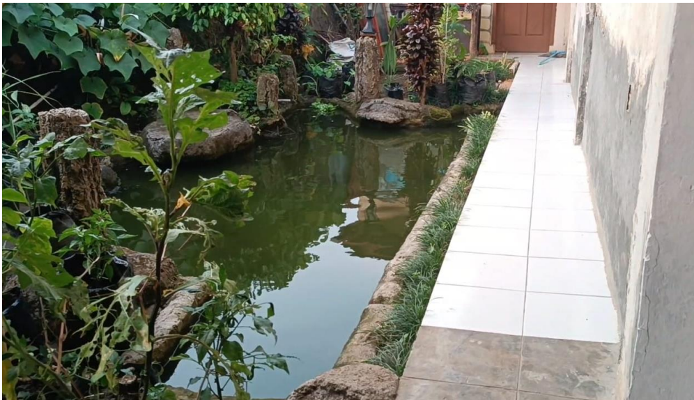
Gambar 10. Kolam ikan

Desa Cikadu dilengkapi dengan sarana dan prasarana yang memadai untuk menunjang kegiatan desa. Diantaranya memiliki beberapa ruangan yang representatif, unit kesehatan desa diantaranya mobil ambulance, mushola, WC, kolam kecil.