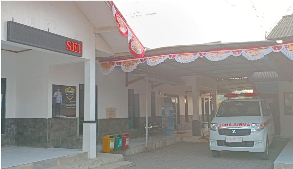
Gambar 9. Sarana dan Prasarana Desa Cikadu

Desa Cikadu dilengkapi dengan sarana dan prasarana yang memadai untuk menunjang kegiatan desa. Diantaranya memiliki beberapa ruangan yang representatif, unit kesehatan desa diantaranya mobil ambulance, mushola, WC, kolam kecil.