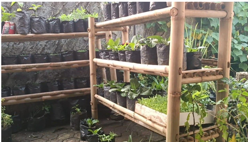
Gambar 12. Taman Desa

Gambar ini menampilkan sinergi desa dalam tugasnya diantaranya adalah kerja sama ibu PKK dalam tugasnya ikut melestarikan lingkungan dan menerapkan Perilaku Hidup Bersih dan Sehat.