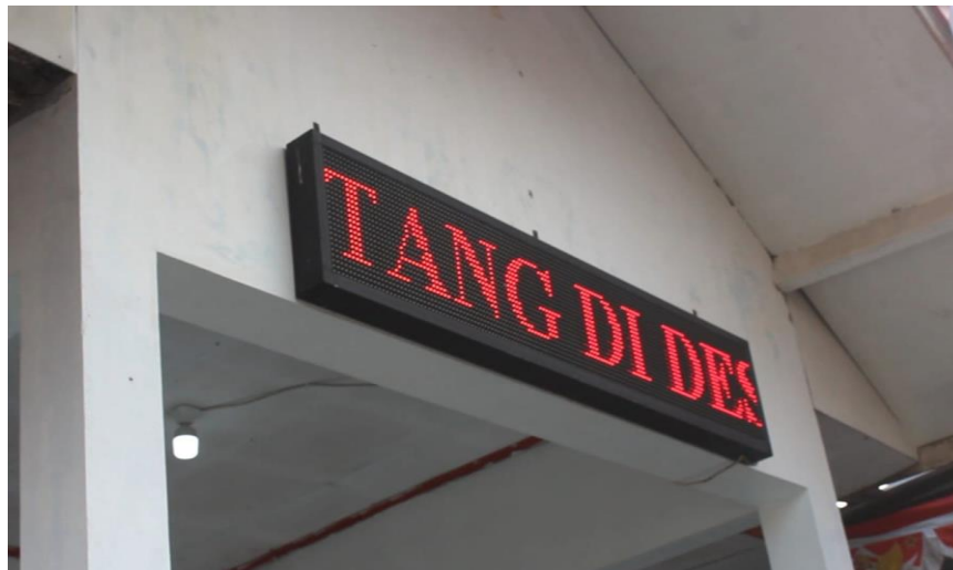
Gambar 5. Opening tulisan “Selamat Datang di Desa Cikadu”

Dengan video profil juga pihak desa dapat dengan mudah untuk menyebarluaskan hasil videonya bisa menggunakan media sosial yang sudah banyak tersedia di zaman sekarang ini. Berikut adalah screenshot dari video profil yang dibuat seperti gambar di bawah ini.