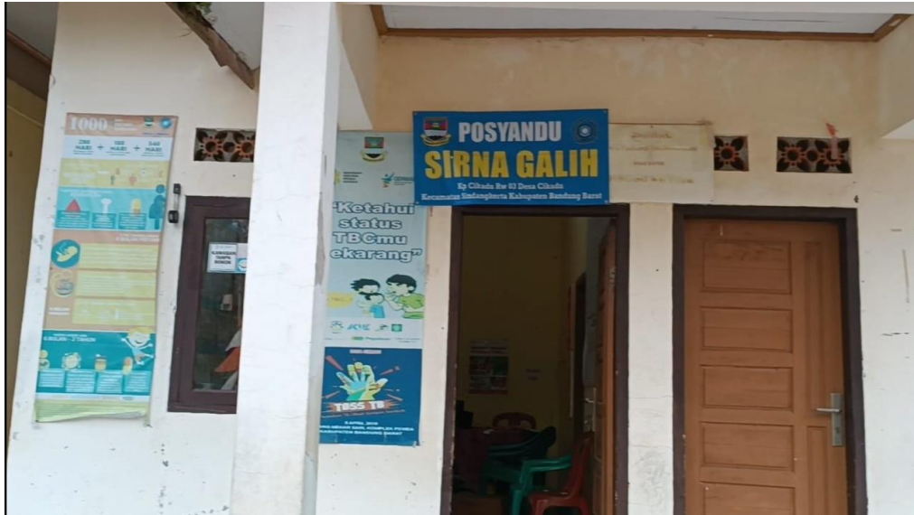
Gambar 13. Salah satu posyandu Desa Cikadu