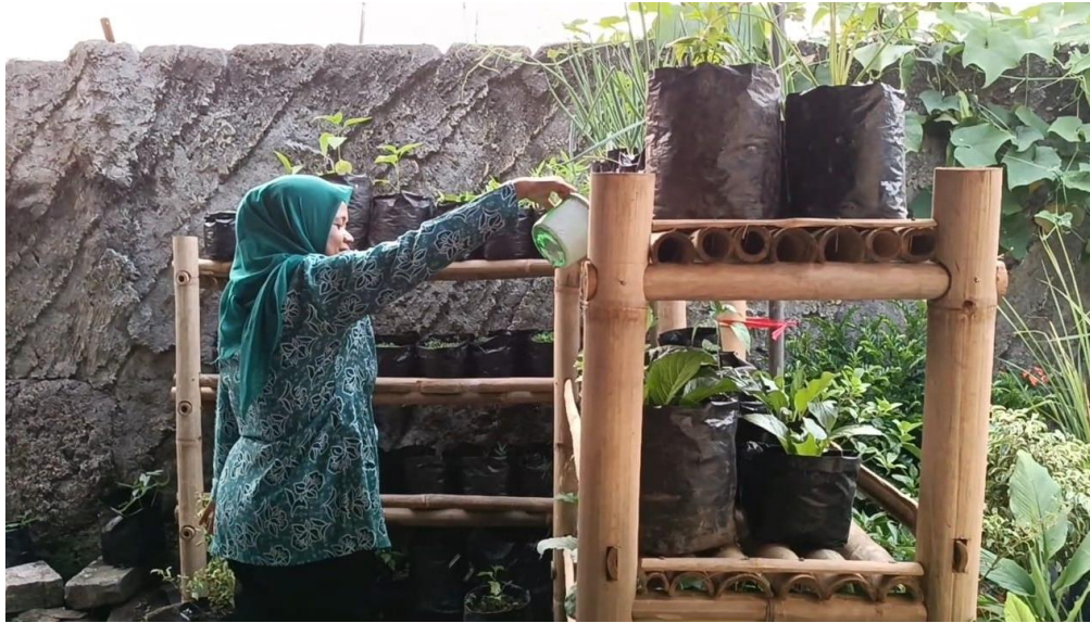
Gambar 11. Ibu PKK dalam menunaikan tugasnya

Gambar ini menampilkan sinergi desa dalam tugasnya diantaranya adalah kerja sama ibu PKK dalam tugasnya ikut melestarikan lingkungan dan menerapkan Perilaku Hidup Bersih dan Sehat.