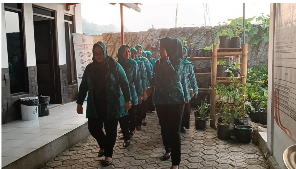
gambar 14. Kebersamaan ibu PKK

Ibu-ibu PKK sedang mengobrol menjalin kebersamaan dan memaparkan jargonnya “Cikadu Mantul”