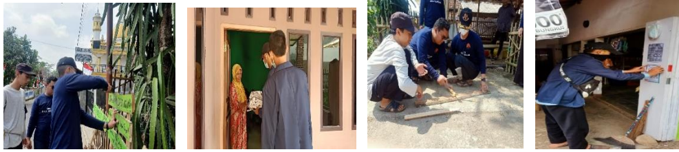
Gambar 7. Kegiatan Kampanye Kesehatan