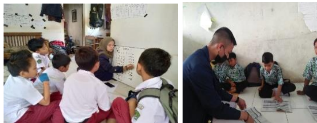
Gambar 5. Kegiatan Tagar

Program ini merupakan program yang ditargetkan kepada anak-anak MI/SD dengan cara penulis sebagai peserta KKN-DR membuka kelas les privat gratis untuk anak-anak yang di sekolahnya diberi tugas dan tidak bisa menyelesaikannya, seperti daam pelajaran matematika, akidah akhlak dan lain –lain. Penulis mengajarkan kepada anak-anak bagaimana penyelesaian nya sampai faham. Program ini dapat terlaksana dengan maksimal.