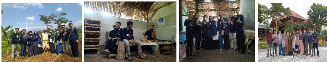
Gambar 4. Kegiatan wisata ekonomi

Ekonomi wisata merupakan program yang buat oleh penulis untuk menyelesaikan permasalahan ekonomi masyarakat setempat, target sasaran nya adalah pelaku usaha UMKM dan Home industri yang ada di Desa Pagersari, diawali dengan mengunjungi warung-warung yang ada di desa pagersari , mengajarkan kepada mereka teori bisnis yang sudah di penulis pelajari di Uin Sunan Gunung Djati , supaya perekonomian dapat pelaku usaha stabil di masa pandemi , selanjutnya penulis mengunjungi beberapa home industri seperti Palawija yang berfokus tentang market pemasarannya, lalu ke pabrik Noga (makana yang terbuat dari gula merah di campur dengan kacang) yang pada awalnya mereka menggunakan toples untuk pemasarannya lalu penulis membuat usulan terkait kemasan plastik supaya lebih lebih praktis.