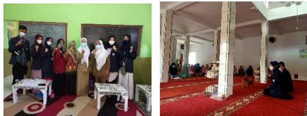
Gambar 6. Kegiatan sosialisasi Vaksin

Program ini dilakukan satu kali pertemuan dan dilaksanakan pada pengajian ibu-ibu, kami membuat program ini karena masyarakat Desa Balananjer kurang akan kesadaran untuk menjaga diri dari virus Corona , masyarakat enggan melakukan vaksinasi yang sudah menjadi program pemerintah untuk itu penulis mensosialisasikan mulai dari asal usul Covid-19, bagaimana Covid-19 bisa menyebar di negara indonesia, bagaimana penyebaran Covid-19 dan bagaimana-pencegahannya seperti vaksinasi dengan tujuan untuk menjaga daya tahan tubuh . dan alhamdulillah program ini dapat terlaksana dengan maksimal dan bkerja sama dengan satgag Covid Desa Pagersari , yang awalnya enggan melakukan vaksinasi akhirnya setelah adanya sosialisasi yang kamu laksanakan , ibu-ibu banyak yang melakukan vaksinasi