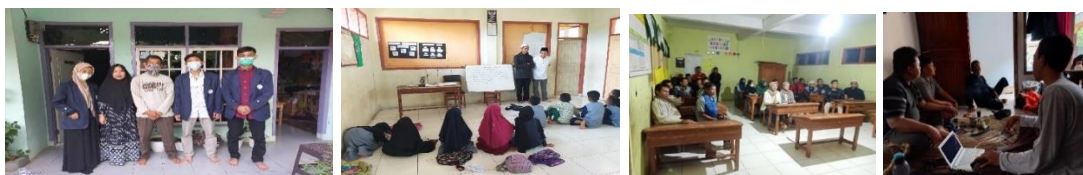
Gambar 3. Kegiatan siklus 2

Untuk lebih jelasnya, dalam bidang ekonomi penulis merencanakan program ECO Wisata (Wisata Ekonomi), dan sosialisasi kepada karangtaruna terkait berwirausaha. Dalam bidang pendidikan yaitu program TAGAR (Temu Anak Giat Belajar), dan pembinaan khusus terkait tahfidz, pidato dan hafalan doa'doa, dan dalam bidang kesehatan penulis merencanakan program SOSIN (Sosialisasi Vaksin), KETAN (Kampanye Kesehatan), dan MIMICA (Minggu Minggu Ceria). Berikut ini beberapa dokumentasi di Siklus 2.