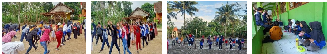
Gambar 8. Kegiatan Mimica bersama anak-anak

Program ini adalah program yang berfokus untuk anak-anak sekolah, kami laksanakan pada hari minggu saja, target dari pelaksanaan ini adalah supaya anak-anak tidak hanya bermain hp saja tapi tetap menjaga kebugaran tubuh agar tetap sehat dengan cara olahraga, dimulai pada pukul 7, semua anak-anak yang mengikuti program ini harus sudah berada dilapangan di lanjut dengan doa bersama lalu melakukan pemanasan dengan cara senam dipandu oleh penulis sebagai peserta KKN-DR, setelah itu melakukan permainan untuk membuat anak-anak bersemangat dan diakhiri dengan makan bersama. Pelaksanaan program ini memakai protokol kesehatan.