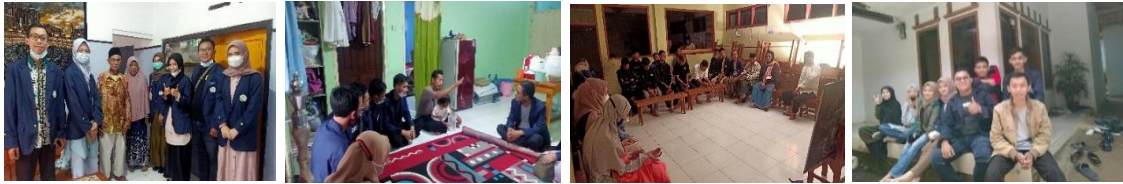
Gambar 2. Kegiatan Siklus 1

Berikut ini beberapa dokumentasi di Siklus 1