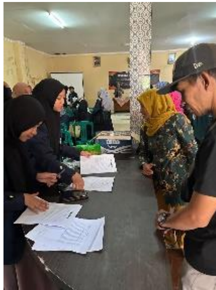
Gambar 1. Pendaftaran Kegiatan Seminar Digitalisasi

Seminar UMKM ini terdapat beberapa tahapan kegiatan yang diawali dengan mengidentifikasi masalah kepada para pelaku usaha dan dilanjutkan dengan menganalisis masalah yang terjadi kemudian menginformasikan kepada para pelaku UMKM bahwa akan diadakannya seminar digitalisasi yang diadakan di Aula Kantor Desa Ciwidey pada hari Sabtu, 5 Agustus 2023 Jam 08.00 – 12.00 dan dihadiri oleh para pelaku UMKM serta Narasumber dari pendamping Plut UKM.