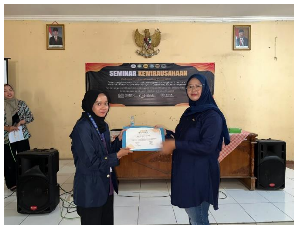
Gambar 3. Penyerahan Sertifikat Kepada Pemateri Seminar Digitalisasi