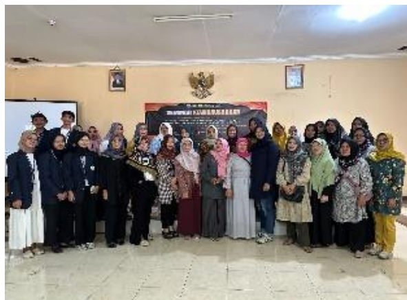
Gambar 4. Foto Bersama Setelah Kegiatan Seminar Selesai