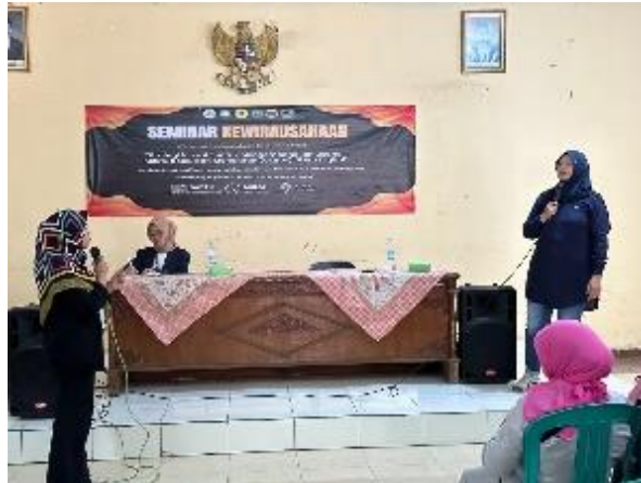
Gambar 2. Pemaparan Materi Kegiatan Seminar Digitalisasi