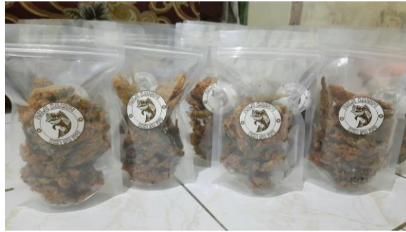
Gambar 5. Produk Nilu Crispy

Setelah ikan nila selesai dibuat dan dikemas ke dalam wadah plastik ziplock, produk pun siap untuk untuk dipasarkan. Dalam hal ini kita mengaplikasikan teori nilai tambah yang dapat meningkatkan ekonomi masyarakat. Karena suatu produk dapat memiliki nilai tambah yang lebih tinggi jika diolah lebih lanjut hingga menjadikannya produk baru, dibandingkan dijual langsung tanpa adanya pengolahan. Kegiatan ini merupakan bentuk sosialisasi pada warga mengenai cara tepat untuk memanfaatkan potensi yang dimiliki Desa Bojongsawah berupa budidaya ikan nila menjadi produk olahan yang bernilai tambah tinggi. Ikan nila yang biasa terjual seharga Rp.40.000 per kg, jika diolah kembali menjadi produk bernilai tinggi, ikan nila tersebut dapat dibandrol menjadi Rp.90.000 per kg. Hal tersebut akan mendorong dan meningkatkan kemampuan masyarakat sehingga masyarakat akan mampu bertahan dan mengembangkan diri dan lingkungan, terlebih lagi dalam bidang ekonomi yang juga terus berkembang seiring bertambahnya jaman. Selain itu keuntungan lainnya ialah, hal ini akan memberikan peluang usaha sekaligus penciptaan lapangan pekerjaan, sehingga diharapkan juga dapat mengatasi masalah tingginya tingkat pengangguran di Desa Bojongsawah.