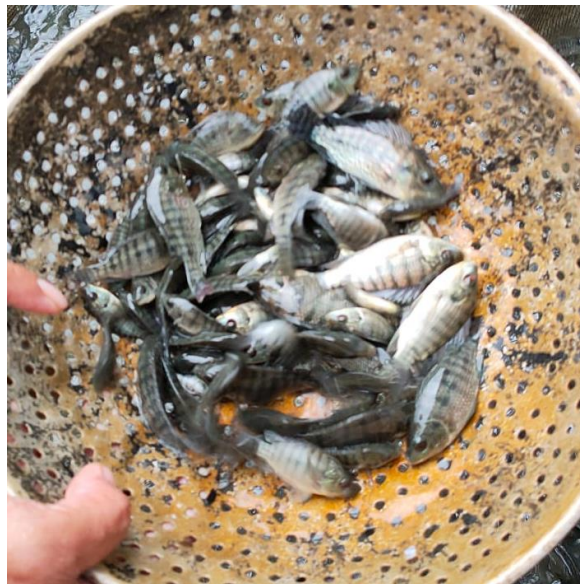
Gambar 2. Ikan Nila Kecil atau Baby Fish

budidaya. 4 Alasan mengapa produk nila crispy dipilih menjadi produk olahan pada pemanfaatan potensi perikanan yaitu karena nila crispy ini merupakan produk camilan yang mudah dibuat, sekaligus mengenyangkan dan mengandung gizi yang baik. Menurut Asia dkk. (2016), hasil penelitian terhadap ikan nila menunjukkan bahwa rata-rata nilas kadar protein ikan nila crispy dengan ukuran berbeda berkisar antara 17.46% - 20.27%. 5 Selain itu, alasan dibuatnya produk nila crispy ini dilatarbelakangi dengan adanya konsumsi ikan yang sering tidak habis hingga tulang dan durinya. Padahal, pada tulang dan duri terdapat kandungan kalsium yang tinggi. Oleh karena itu, produk nila crispy dibuat dengan menggunakan ikan nila kecil atau biasa disebut dengan Baby Fish , karena dengan menggunakan ikan-ikan kecil tersebut, akan memudahkan konsumen dalam mengkonsumsinya karena semua bagian ikan hampir bisa dimakan kecuali bagian isi perutnya yang sudah dibuang.