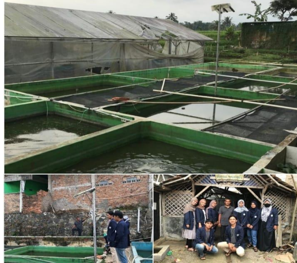
Gambar 3. Konsultasi Perihal Ikan Nila

Sebelum masuk kepada proses pengolahan ikan nila, kami terlebih dahulu datang ke tempat lokasi budidaya ikan nila. Konsultasi ini dilakukan dengan cara mewawancarai narasumber Bapak Dudan Muqodas S.Pd.I yang mana beliau merupakan pendiri sekaligus pemilik usaha ikan nila tersebut.