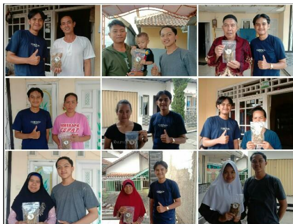
Gambar 6. Para Pembeli Nilu Crispy

Setelah ikan nila selesai dibuat dan dikemas ke dalam wadah plastik ziplock, produk pun siap untuk untuk dipasarkan. Dalam hal ini kita mengaplikasikan teori nilai tambah yang dapat meningkatkan ekonomi masyarakat. Karena suatu produk dapat memiliki nilai tambah yang lebih tinggi jika diolah lebih lanjut hingga menjadikannya produk baru, dibandingkan dijual langsung tanpa adanya pengolahan. Kegiatan ini merupakan bentuk sosialisasi pada warga mengenai cara tepat untuk memanfaatkan potensi yang dimiliki Desa Bojongsawah berupa budidaya ikan nila menjadi produk olahan yang bernilai tambah tinggi. Ikan nila yang biasa terjual seharga Rp.40.000 per kg, jika diolah kembali menjadi produk bernilai tinggi, ikan nila tersebut dapat dibandrol menjadi Rp.90.000 per kg. Hal tersebut akan mendorong dan meningkatkan kemampuan masyarakat sehingga masyarakat akan mampu bertahan dan mengembangkan diri dan lingkungan, terlebih lagi dalam bidang ekonomi yang juga terus berkembang seiring bertambahnya jaman. Selain itu keuntungan lainnya ialah, hal ini akan memberikan peluang usaha sekaligus penciptaan lapangan pekerjaan, sehingga diharapkan juga dapat mengatasi masalah tingginya tingkat pengangguran di Desa Bojongsawah.