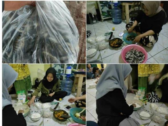
Gambar 4. Proses Pembuatan Nila Crispy

Pada proses pembuatan nila crispy, terdapat bahan-bahan yang dibutuhkan beberapa diantaranya adalah Ikan Nila kecil, tepung terigu, telur ayam, tepung beras, jeruk nipis, minyak goreng, bawang putih, garam, ketumbar, merica, kaldu ayam bubuk, soda kue, dll. Sedangkan peralatan-peralatan yang digunakan pada pengolahan ikan nila ini adalah: pisau, mangkok, peralatan penggorengan, talenan, nampan, dll. Adapun tahapan-tahapan dalam membuat nila crispy ini, berikut adalah tahapannya.