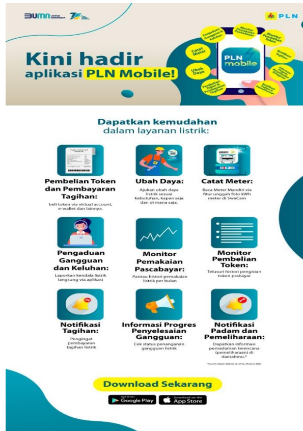
Gambar 1. Manfaat aplikasi PLN Mobile

Indikator yang terakhir adalah sebanyak 90% dari masyarakat yang mengikuti sosialisasi ini mengetahui bagaimana tata cara atau langkah-langkah penggunaan aplikasi PLN Mobile. Itu memiliki arti bahwa aplikasi PLN Mobile cukup mudah untuk dipahami dan digunakan oleh masyarakat.