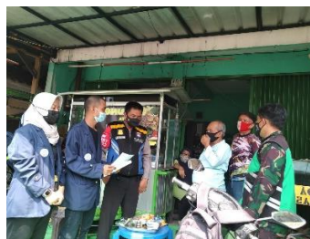
Gambar 1. Sosialisasi vaksin kepada warga RW 03