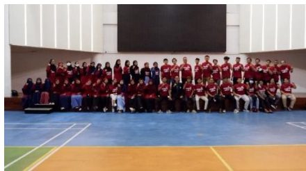
Gambar 6b. Kegiatan vaksinasi Covid-19