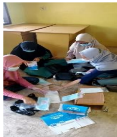
Gambar 3b. Persiapan masker dan handsinitizer yang akan dibagikan kepada warga RW 03