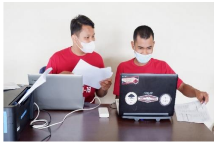
Gambar 6a. Kegiatan vaksinasi Covid-19