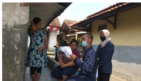
Gambar 2. Sosialisas Covid19 kepada warga RW 03