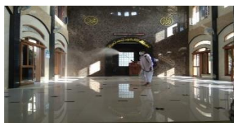
Gambar 5a. Penyemprotan disinfektan di Kawasan warga RW 03