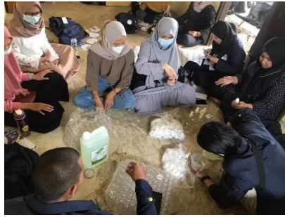
Gambar 3a. Persiapan masker dan handsinitizer yang akan dibagikan kepada warga RW 03