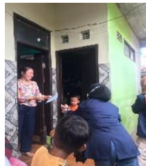
Gambar 4. Pembagian masker dan hand sanitizer kepada warga RW 03