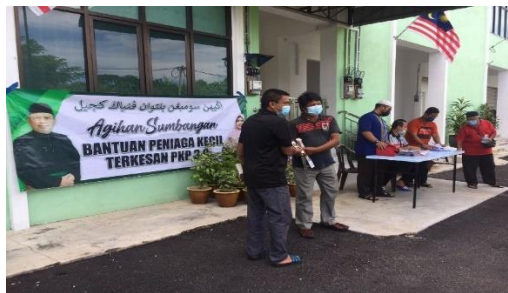
Gambar 2. menjadi sukarelawan dalam membantu pengagihan bantuan peniaga kecil akibat covid 19