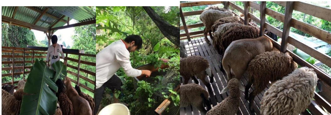
Gambar 4. berkebun serta memberi makan makanan kepada haiwan ternakan dan peliharaan milik orang desa