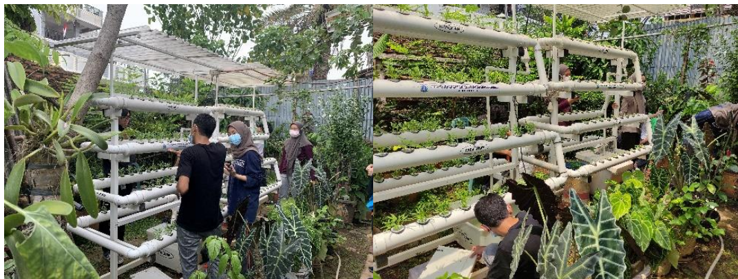
Gambar 3. Penanaman Tanaman Hidroponik

Setelah kegiatan penanaman tanaman bayam dan sawi pada media hidroponik selesai, selanjutnya dilakukan kegiatan bersih-bersih lahan bersama dengan seluruh peserta KKN 292, ketua RW 07, dan seluruh masyarakat yang antusias ikut serta dalam kegiatan penghijauan ini. Dalam kegiatan bersih-bersih lahan, kami mengumpulkan sampah-sampah daun kering, menyisihkan sampah plastik, dan sampah organik. Pelaksanaan kegiatan penghijauan melalui penanaman tanaman hidroponik disertai dengan bersih-bersih lahan memberikan manfaat dan hasil yang besar bagi lingkungan RW 07. Taman penghijauan kini terlihat lebih rapi dan bersih, yang siap menghasilkan hasil panen tanaman hidroponik yang segar untuk dikonsumsi.