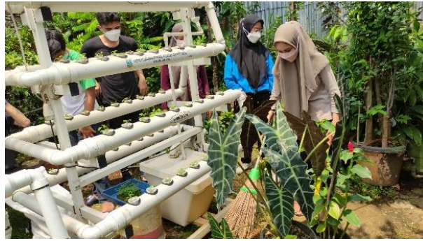
Gambar 4. Bersih-bersih lahan