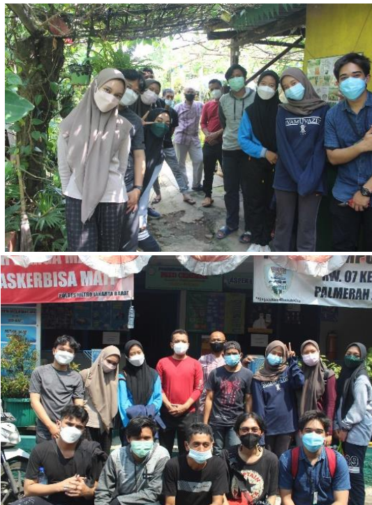
Gambar 5. Foto bersama dengan Ketua RW 07 dan masyarakat setelah penghijauan