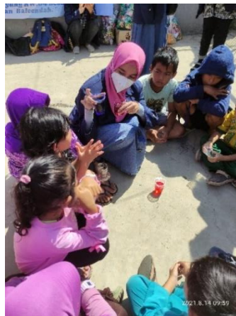
Gambar 1. Pemberian Edukasi Pengenalan Warna