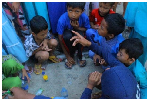
Gambar 2. Pemberian Edukasi Eksperimen 'Belalai Gajah'