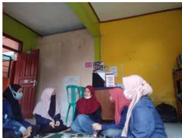
Gambar 4. Perencanaan Program Kegiatan

Setelah mendengarkan masalah yang dihadapi oleh para santri. Kami membuat perencanaan guna mengatasi masalah yang mereka hadapi.