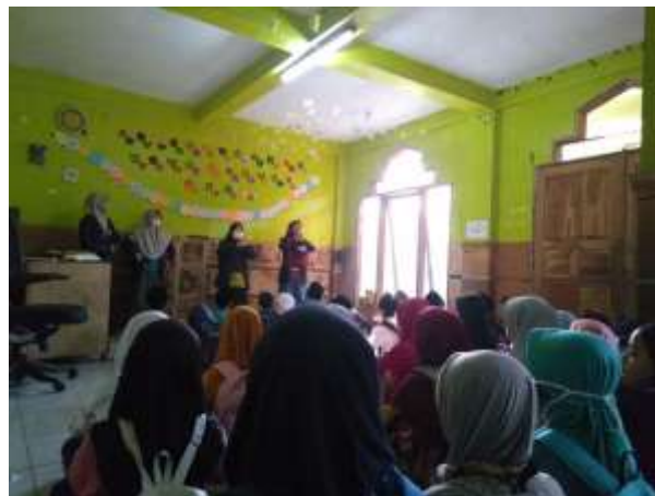
Gambar 6. Motivasi Belajar

Dengan harapan hal tersebut membuat anak senang belajar dan semangat.