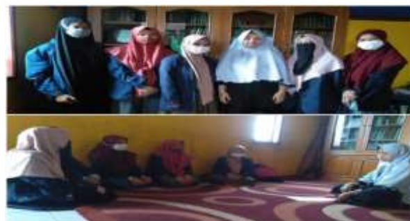
Gambar 2. Perizinan KKN DR

Dengan sosialisasi mereka mengetahui tujuan kami berada disini. Pada tahap ini para santri mengutarakan kendala mereka dalam mempelajari tashrifan adalah merasa kesusahan karena banyaknya bab yang harus dihafal. Selain itu karena kurangnya motivasi mereka dalam menghafal.