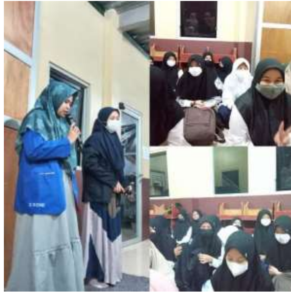
Gambar 5. Pembukaan KKN

Sebelum memulai kegiatan agar berlangsung dengan semangat dan juga bahagia maka di adakan nya motivasi awal kepada anak anak yang akan mengikuti kegiatan ini. Dengan memberikan reward agar mereka terpacu untuk semangat belajar. Disini kami me refresh semangat anak anak agar belajar dengan aktif dan sungguh-sungguh, melalui game edukasi, serta pembelajaran yang interaktif, agar para anak tidak pasif.