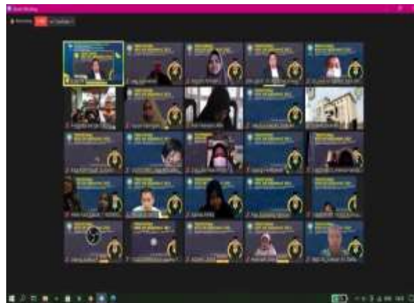
Gambar 14. Penutupan KKN

KKN secara resmi ditutup oleh Rektor UIN Sunan Gunung Djati yang diwakilkan oleh wakil rektor 1 melalui aplikasi Zoom, Selasa 31 Agustus 2021.