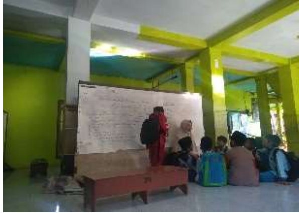
Gambar 7. Pembelajaran harian