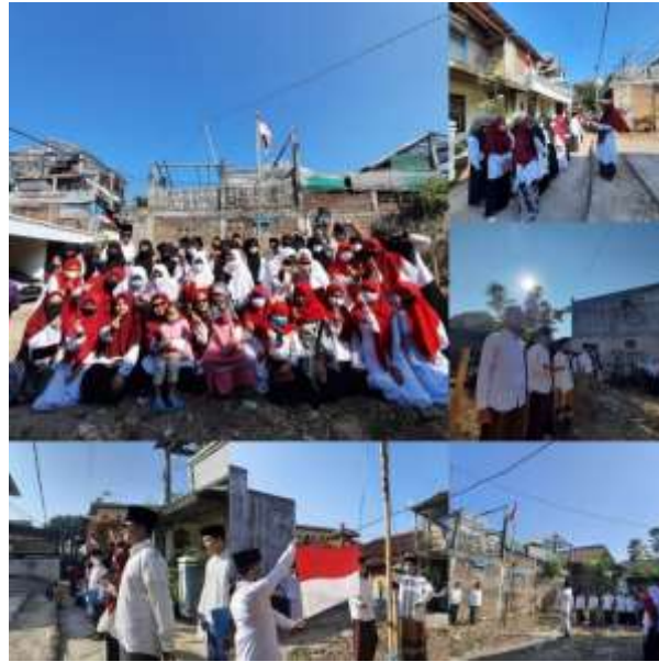
Gambar 9. Upacara peringatan HUT RI ke-76

Perlombaan 17 Agustus Masih dalam memeriahkan peringatan HUT RI, perlombaan berlangsung setelah upacara dilaksanakan, mulai dari makan kerupuk, baca puisi, fashion show, menggambar, dan lain-lain. Acara dapat dilaksanakan atas kerjasama peserta KKN dan pengurus Pondok Pesantren.