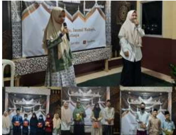
Gambar 13. Penutupan kegiatan & pembagian Hadiah

KKN secara resmi ditutup oleh Rektor UIN Sunan Gunung Djati yang diwakilkan oleh wakil rektor 1 melalui aplikasi Zoom, Selasa 31 Agustus 2021.