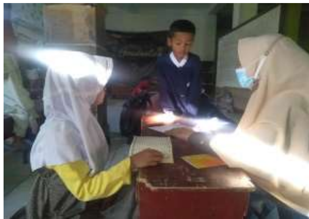
Gambar 8. Setoran Qur'an

Pembelajaran qur'an juga ada baik metode talaqqi, yaitu di simak kemudian yang salah di perbaiki, juga metode hafalan, dimana anak menyetorkan hafalannya agar di rumah bisa menyempatkan waktunya untuk menghafal sedikit demi sedikit, dengan ini anak terbiasa dengan al – qur'an.