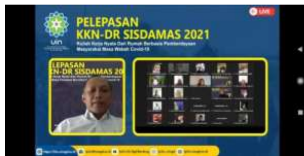
Gambar 1. Pelepasan KKN DR