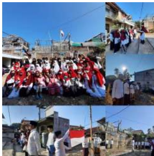
Gambar 10. Perlombaan 17 Agustus

Perlombaan 17 Agustus Masih dalam memeriahkan peringatan HUT RI, perlombaan berlangsung setelah upacara dilaksanakan, mulai dari makan kerupuk, baca puisi, fashion show, menggambar, dan lain-lain. Acara dapat dilaksanakan atas kerjasama peserta KKN dan pengurus Pondok Pesantren.