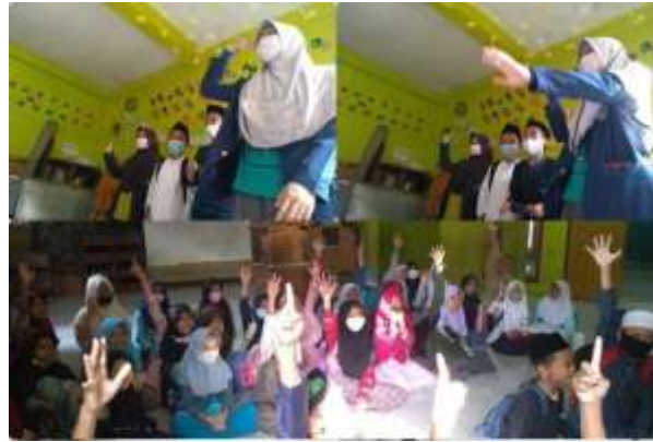
Gambar 3. Sosialisasi

Setelah mendengarkan masalah yang dihadapi oleh para santri. Kami membuat perencanaan guna mengatasi masalah yang mereka hadapi.