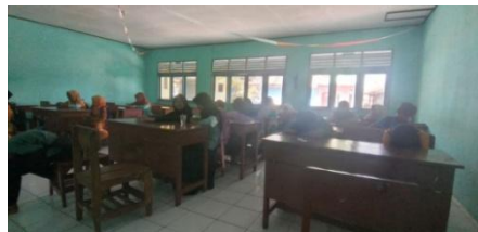
Gambar 14. Menerapkan kebiasaan membaca Asmaul Husna sebelum pembelajaran dimulai