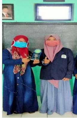
Gambar 4. Perizinan Kepala Madrasah Diniyah