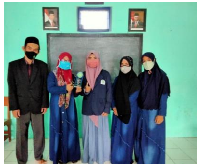
Gambar 19. Penutupan KKN-DR