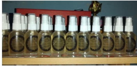
Gambar 17. Pembuatan Handsanitizer