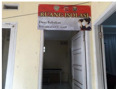
Gambar 5. Mengecek ruangan isolasi di Desa