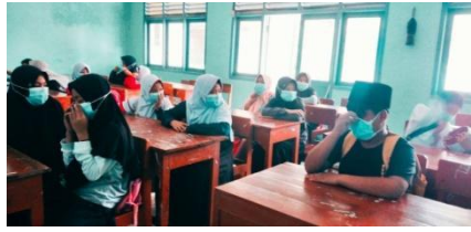
Gambar 12. Tata cara penggunaan masker dengan baik