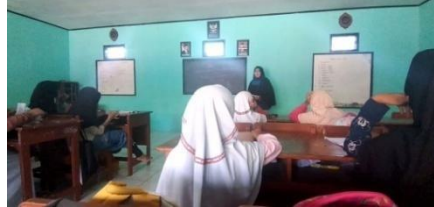
Gambar 13. Mengenalkan asal-usul wabah penyakit di zaman Rasulullah saw