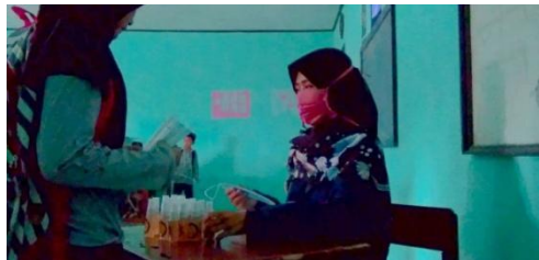
Gambar 18. Pembagian Handsanitizer