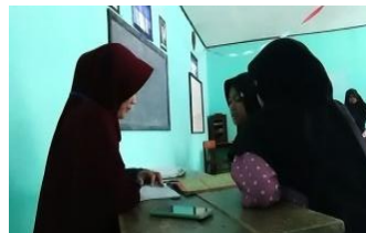
Gambar 10. Membimbing anak-anak belajar mengaji