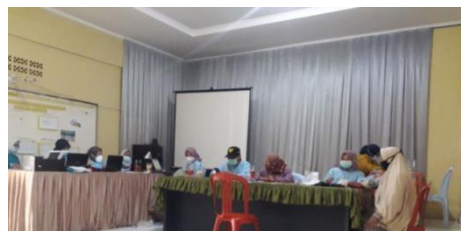
Gambar 16. Kegiatan Vaksinasi di desa Babakan