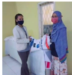
Gambar 9. Pembagian Bantuan Saluran Beras (BSB) PPKM