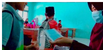
Gambar 11. Pembagian Masker