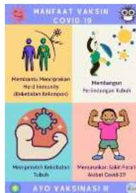
Gambar 7. Poster Manfaat Vaksin Covid-19

Bahan utama yang terdapat di dalam hand sanitizer adalah Alkohol. Secara kimiawi, alkohol yaitu suatu molekul organik yang tersusun atas karbon, oksigen dan hidrogen. Alkohol ini bekerja dengan cara menghancurkan kuman penyakit yaitu dengan memecah protein, membelah sel menjadi beberapa bagian hingga akhirnya kuman mengalami lisis atau keadaan saat seluruh materi di dalam tubuh kuman, mengalami difusi keluar sel. Kemampuan alkohol akan meningkat dalam mematikan kuman jika konsentrasi alkoholnya bertambah. Hasil penelitian menunjukkan bahwa alkohol dengan konsentrasi melebihi 60% mampu membunuh berbagai bakteri dan virus. Alkohol sendiri membuat bakteri tidak bisa mempertahankan daya tahannya sehingga alkohol ini efektif pada penggunaan berkelanjutan. Efektivitas alkohol maksimal pada kadar 90-95 persen (Lusiana dkk, 2020).