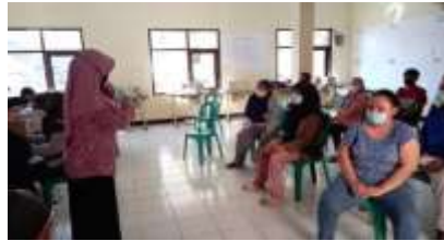
Gambar 2. Kegiatan sosialisasi kepada masyarakat mengenai pentingnya menjaga protokol kesehatan dan vaksinasi

dapatkan setelah divaksin seperti membantu terbentuknya Herd immunity (kekebalan kelompok), membangun perlindungan tubuh, memperoleh kekebalan tubuh dan menurunkan sakit parah akibat Covid-19.