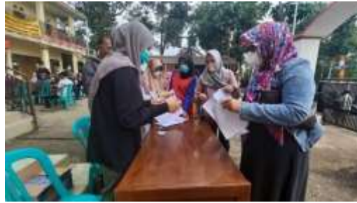
Gambar 10. Terlihat warga yang sudah tertib memakai masker

Maka dari itu, kami menyimpulkan dengan memberikan bantuan masker secara gratis dan pemberian informasi 3M adalah hal yang tepat, bahwa masyarakat sadar akan pentingnya penggunaan masker saat beraktivitas diluar rumah guna mencegah penyebaran Covid-19.