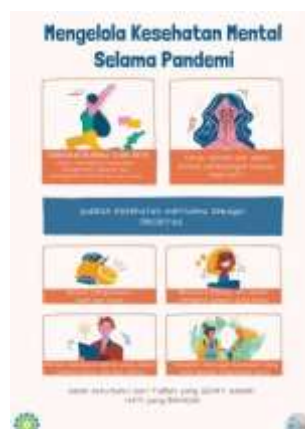
Gambar 8. Poster Cara Mengelola Kesehatan Mental Selama Pandemi Covid-19

Gambar 7 yang merupakan poster ke-2 memaparkan informasi terkait manfaat vaksin covid-19, yaitu membantu menciptakan Herd Immunity (kekebalan tubuh), membangun perlindungan tubuh, memperoleh kekebalan tubuh, menurunkan sakit parah akibat covid-19, dan masih banyak lagi. Hal ini dilakukan untuk menarik perhatian masyarakat Desa Cinanjung agar memiliki pemikiran yang positif terhadap adanya vaksin covid-19.