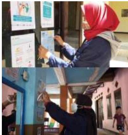
Gambar 5. Penempelan poster di Aula Desa Cinanjung dan RA/TPA Al-Fajri

Kemudian di hari yang sama pada tanggal 16 Agustus 2021 setelah acara vaksinasi selesai, kami melakukan penempelan poster di aula Desa Cinanjung, Madrasah dan TPA Al-Fajri.