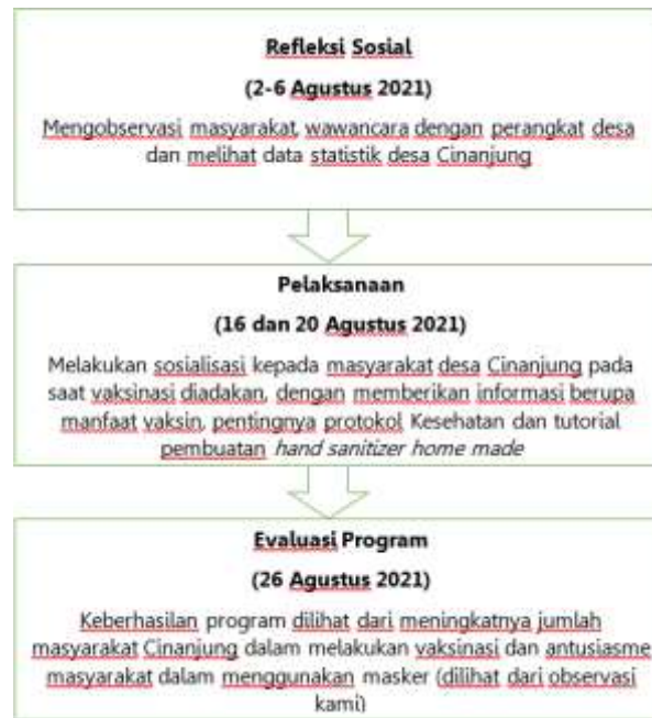
Gambar 1. Diagram Alir Pelaksanaan Sosialisasi Covid-19 di Desa Cinanjung