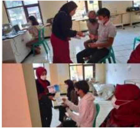
Gambar 4. Pemberian masker kepada masyarakat

Kemudian di hari yang sama pada tanggal 16 Agustus 2021 setelah acara vaksinasi selesai, kami melakukan penempelan poster di aula Desa Cinanjung, Madrasah dan TPA Al-Fajri.