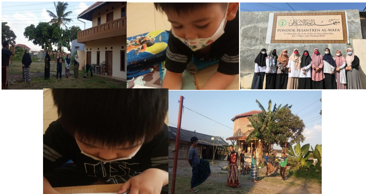
1.B Dokumentasi siklus II:

Kemudian dilanjutkan juga dengan membantu tugas sekolah yang diberikan guru secara online seperti menghafal surat-surat pendek Al-Quran, menghafal perkalian dan melakukan pengajaran matematika seperti aplikasi perkalian dan pembagian. Namun sebelum beranjak mengerjakan tugas saya memberikan sedikit pemahaman mengenai materi yang belum dipahami pada saat pembelajaran di sekolah. Mengingat kurangnya efektif sistem pembelajaran yang diterima oleh siswa, sehingga siswa merasa tidak dapat memahami. Untuk itu saya berusaha memberikan pemahaman ulang yang telah disampaikan oleh guru.