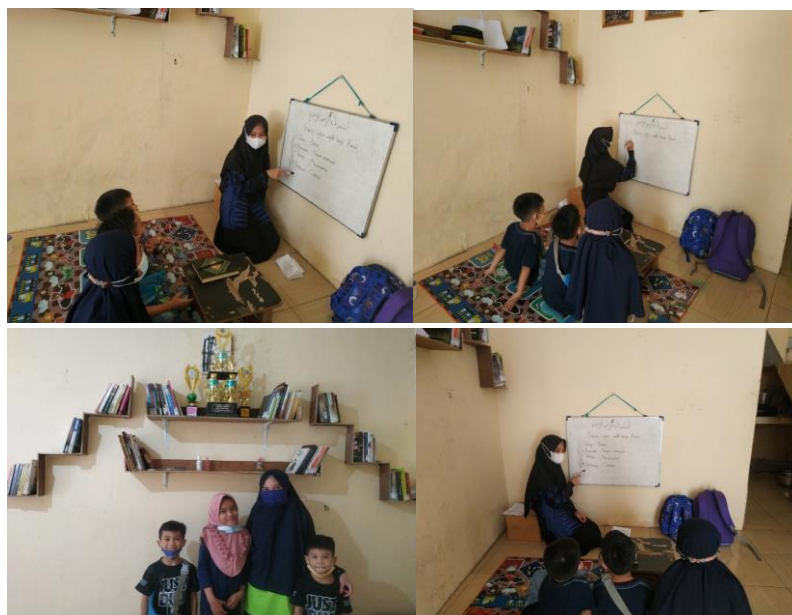
1.C Dokumentasi siklus III:

Lalu pada hari Sabtu dan Ahad kamis saya juga membantu mengajarkan materi pelajaran matematika dan ilmu pengetahuan alam. Sebelum mengerjakan tugas yang mereka miliki, saya mengajak mereka untuk memahami materi terlebih dahulu. Sebab mereka sama sekali tidak mengetahui cara bahkan materi apa yang sebenarnya berkaitan dengan tugas. Untuk itu saya merasa perlu untuk mengajak untuk memahami materi. Selanjutnya mereka diajak untuk menghafalkan perkalian dan rumus. Sebab hal itu menjadi komponen sangat penting dalam matematika. Hal ini menjadikan anak terlatih untuk mengingat materi pelajaran matematika dan ilmu pengetahuan alam.