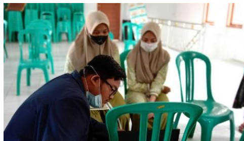
Gambar 2. Praktik materi ZOOM

Setelah pemaparan seara teoritis kemudian kegiatan dilanjutkan dengan praktik yang dilaksanakan langsung oleh peserta yang mana didampingi oleh anggota kelompok KKN 140.