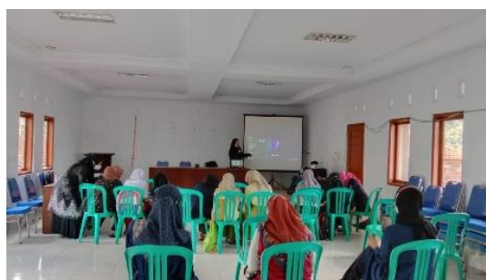
Gambar 5. Pemaparan materi Google Form

Pada materi ini dilakukan kegiatan pemaparan serta praktik materi tentang penulisan data dengan menggunakan teknologi dari perangkat lunak Google form sehingga kegiatan ini lebih ditujukan kepada guru untuk mendapatkan data yang diinginkan dalam kasus ini Google form digunakan sebagai media pengambilan data absensi dari siswa dimana dalam pelaksanaannya para peserta kegiatan melakukan pembuatan link serta format dalam Google Form sesuai dengan kebutuhan dan tujuannya menggunakan perangkat lunak ini, sebelumnya kebanyakan dalam pertemuan daring (Dalam Jaringan) para guru masih banyak yang melakukan absen manual dengan cara memanggil nama bahkan ada juga yang tidak melaksanakan kegiatan absensi samasekali dikarenakan kebingungan untuk teknis dalam melaksanakan ataupun pengumpulan absensi. Maka dari itu pada workshop atau pelatihan ini dimasukkan materi untuk pengumpulan data dengan menggunakan Google Form sehingga dalam kegiatan belajar maupun mengajar menjadi lebih efektif dan memiliki data absensi yang konkrit serta jelas.