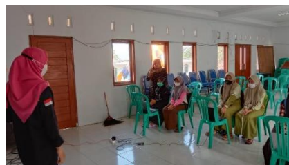
Gambar 3. Pemaparan materi Ms, Word

Pada materi ini telah dilakukan kegiatan pemaparan serta pengerjaan praktik langsung oleh peserta dengan menggunakan perangkat lunak Microsoft Word sebagai media penulisan tugas yang mumpuni dan banyak digunakan di berbagai instansi, pada intinya keterampilan serta pengetahuan tentang perangkat lunak ini merupakan hal yang sangat penting yang harus dimiliki oleh setiap individu terutama para peserta kegiatan Workshop ataupun pelatihan ini. Pada materi ini dilakukan pemaparan yang langsung dipraktikan oleh peserta kegiatan.