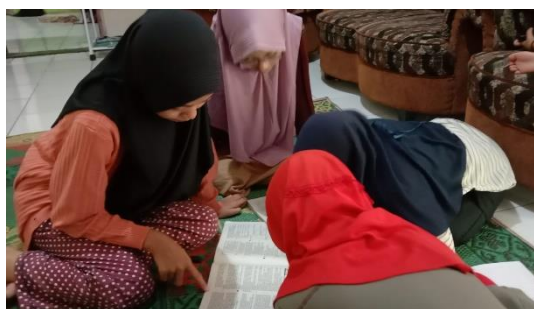
Gambar 7. Kegiatan Konsultasi

Peningkatan pendidikan dapat dilihat hasilnya dari kegiatan konsultasi yang berlokasi di posko KKN 140 yang mana dilaksanakan setiap hari sehingga anggota KKN 140 dapat memantau progres dari kualitas pendidikan serta pemanfaatan teknologi yang digunakan setiap harinya karena pada sesi konsultasi yang mana pada awal kegiatan para siswa sangat kurang bisa dalam memahami materi yang diberikan oleh guru sekolahnya masing – masing bahkan ada juga yang tidak memberikan pertemuan daring (Dalam Jaringan) karena keterampilan kemampuan pemanfaatan teknologi pembelajaran yang dimiliki oleh guru sekolahnya juga masih minim bahkan tidak sedikit yang tidak mengetahui teknologi – teknologi tersebut.