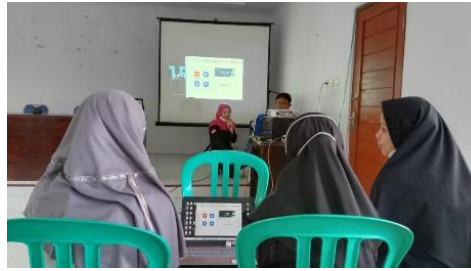
Gambar 1. Pemaparan Materi ZOOM

daring (Dalam Jaringan), dengan pemaparan materi secara teoritis ini maka peserta pelatihan akan mampu memahami secara konsep maupun gambaran fungsi dari perangkat lunak tersebut.