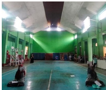
Gambar 8. Perlombaan Rangking 1

Selain dengan kegiatan konsultasi pembelajaran indikator peningkatan kualitas pendidikan jarak jauh dengan menggunakan teknologi ICT (Information and Communication Technology) juga dapat dilihat dari perlombaan "Ranking 1".