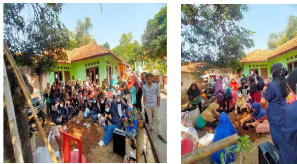
Gambar 2. Pelaksanaan Program SABDARUM

Konsep program SABDARUM yang dilaksanakan mencakup 3 tahap yaitu : tahap persiapan, tahap pelaksanaan dan tahap evaluasi dimana program ini dilaksanakan dalam siklus keempat KKN DR SISDAMAS. Tahap pertama yaitu persiapan, dilaksanakan kegiatan penyediaan alat dan bahan seperti penyediaan pupuk, tanah, bibit tanaman, polybag serta mempersiapkan tempat percontohan dalam pelaksanaan program SABDARUM. Tahap kedua yaitu pelaksanaan merupakan proses realisasi program SABDARUM yang telah dirancang yang dilakukan di salah satu rumah warga sebagai contoh pelaksanaan program SABDARUM. Pelaksanaan program dikemas dengan konsep adanya pelibatan langsung dari masyarakat RW 05 dusun Pahing dalam proses penanaman dan adanya pembagian benih sayuran kepada masyarakat RW 05 yang diharapkan bisa menjadi pemancing awal terhadap dilaksanakannya program sabdarum di setiap rumahnya. Tahap ketiga yaitu evaluasi, dimana dalam tahap ketiga ini program yang telah dilaksanakan ditinjau kembali dampaknya terhadap masyarakat. Berdasarkan hasil observasi dan wawancara dari masyarakat bahwasannya mereka sangat antusias dengan adanya program SABDARUM ini dikarenakan masyarakat bisa lebih produktif dalam menjalani aktivitas sehari-hari dan mendatangkan banyak manfaat. Selain itu setelah pelaksanaan program, masyarakat mulai untuk melaksanakan program SABDARUM dengan menanam lahan pekarangan rumahnya dengan berbagai macam bibit sayuran.