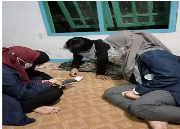
Gambar 7. Pelatihan digital branding iklan online dan pembuatan voucher diskon

Hasilnya karang taruna jadi lebih mempunyai wawasan yang luas tentang digital marketing dan iklan secara online serta pembuatan voucher diskon untuk lebih banyak di kenal oleh masyarakat salah satunya dengan memberikan diskon bagi yang sudah mengikuti dan belanja di toko tersebut