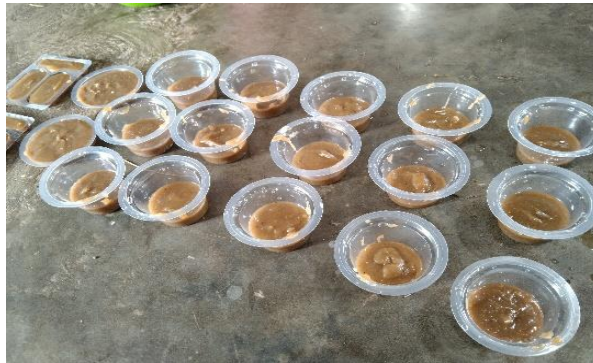
Gambar 3. Praktek pembuatan sabun dari minyak jelantah

usaha baru bagi masyarakat, langkah selanjutnya adalah tahap praktek pembuatannya.