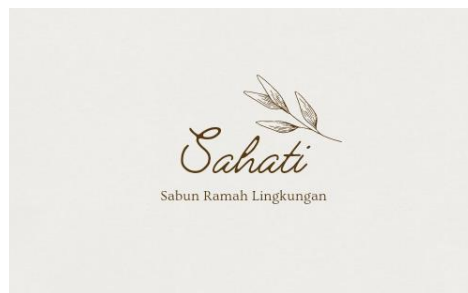
Gambar 5. Logo produk sabun 'Sahati'

Pada produk sabun ini kami memutuskan untuk memberi nama logo atau merek sabun 'SAHATI' yang memiliki arti sabun ramah lingkungan produk cikereti. Cikereti adalah nama kampung karang taruna itu berdiri.