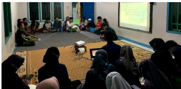
Gambar 2. Sosialisasi dan pemahaman karang taruna tentang Konsep 3R dan Digital Branding

Sosialisasi dan pemahaman masyarakat tentang Limbah Minyak jelantah dengan menggunakan konsep Circular Economy 3 R ( Reduce – Reused – Recycle ) dan Digital Branding. Kegiatan yang kedua adalah memberikan sosialisasi dan pemahaman masyarakat tentang pengelolaan limbah minyak jelantah dengan menggunakan konsep Circular Economy 3 R ( Reduce – Reused – Recycle ) sesuai konsep ini mengubah limbah atau sampah menjadi barang yang bermanfaat , dari bahan dasar minyak jelantah bisa dijadikan sabun ramah lingkungan , bisa di gunakan untuk mencuci tangan dan mencuci piring. Tidak hanya ramah lingkungan sabun ini juga bisa menjadi barang yang bernilai ekonomis, dan bisa menjadi salah satu ide usaha bagi masyarakat.