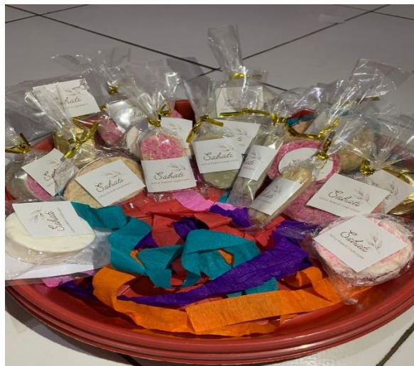
Gambar 4. Pengemasan dan Digital Branding Sabun 'Sahati'

Dalam Praktek ini selain bahan dasar limbah minyak jelantah di butuhkan juga bahan bahan tambahan diantaranya adalah garam, areng, dan soda api, serta tambahn nya bisa daun jeruk nipis sebagai pewanginya. Dalam praktik ini banyak yang harus di perhatikan dari mulai pemahaman takaran adonanya, da nada salah satu bahan yang cukup berbahaya yaitu soda api, apabila kena kulit tangan manusia akan menimbulkan efek gatal