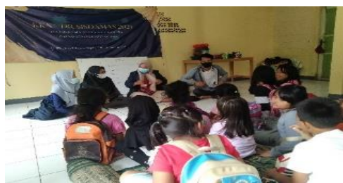
Gambar 2. Kegiatan Les Anak

Mengajar Les bertujuan untuk membimbing dan memberikan edukasi ke anak, seperti belajar mata pelajaran sekolah dan membantu menjelaskan kepada anak untuk mengerjakan pekerjaan rumah.