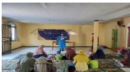
Gambar 5. Diskusi Hak Asuh Anak

Diskusi Hak Asuh Anak yakni menjelaskan kepada masyarakat mengenai banyak hak tentang hak hak asuh anak kepada warga Rw 016