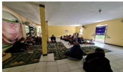
Gambar 4. Career day

Career day merupakan kegiatan yang memiliki tujuan agar agar dapat mengetahui macam macam pekerjaan yang dapat meningkatkan motivasi anak anak untuk dapat mencapai cita citanya.