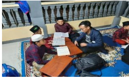
Gambar 3. Les Ngaji Anak