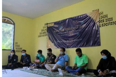
Gambar 1. Pembukaan KKN-DR di Mushola Al Hijrah