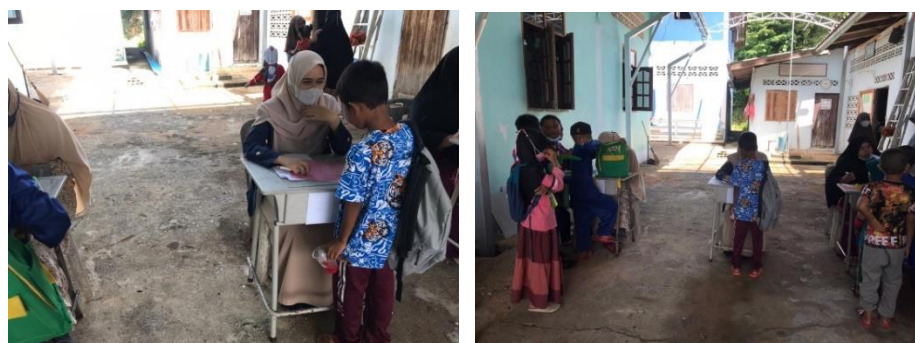
Gambar 4. Membantu Guru Memeriksa Tugas

Pada kegiatan ini dilaksanakan di luar kelas atau ditempat perhimpunan pelajar untuk memudah pematuhan penjagaan jarak. Penyerahan tugas kepada siswa dilaksanakan pada hari minggu, untuk kelas 1-3 dilaksanakan pada jam 09:00 – 10:00 pagi waktu tempatan (Thailand) dan untuk siswa kelas 4-6 dilaksanakan pada jam 10:00-11:00 pagi waktu tempatan (Thailnad). kemudian untuk pemeriksaan tugas (PR) dilaksanakan pada hari minggu jam 09:00-10:00 untuk kelas 1-3 dan jam 10:00-11:00 untuk kelas 4-5. Kegiatan tersebut ditangani oleh beberapa guru yang telah dijadwalkan bertugas pada hari tersebut.