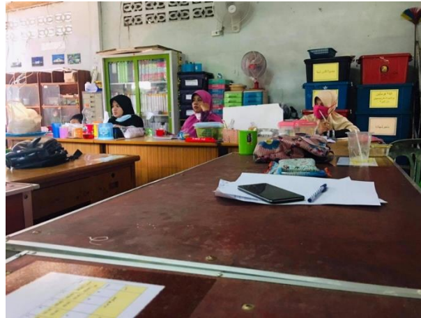
Gambar 3. Mengikuti rapat Guru dan staf Sekolah Tadika Nurul islamiah Bukit berangan