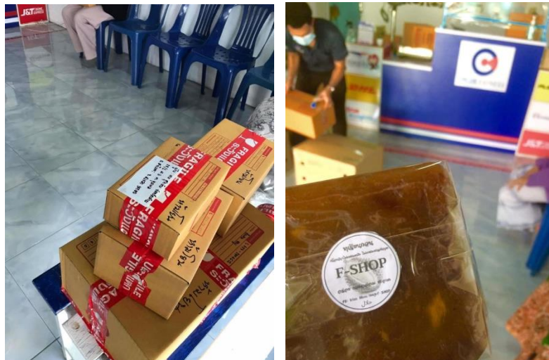
Gambar 8. Membantu penduduk desa mengemas produk dan menjual produk di media sosial