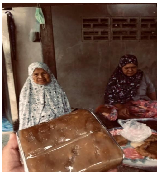
Gambar 2. Mengajar warga desa mengemas produk untuk dipasarkan