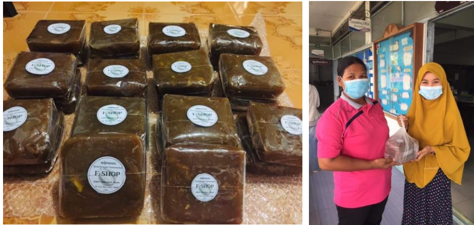
Gambar 7. Membantu penduduk desa mengemas produk

Pada kegiatan ini, penulis dan penduduk desa mengemas produk menjadi lebih rapih dan bersih. Kemudian setelah pengemasan selesai dilakukan, penulis mengirim produk kepada pembeli yang telah memesan produk tersebut