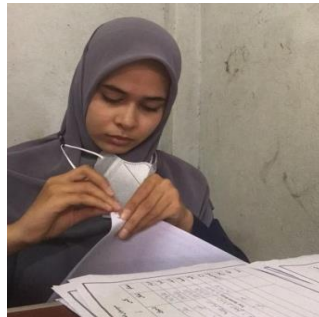
Gambar 5. Membantu pegawai sekolah menguruskan aturan jadwal harian guru

Pada kegiatan ini penulis membantu pegawai sekolah menyusun jadwal untuk guru-guru dan membantu pegawai input nilai ke dalam system sekolah. Selain itu penulis juga membantu menyusun kembali dokumen-dokumen terkait pelajar dan sekolah tersebut.