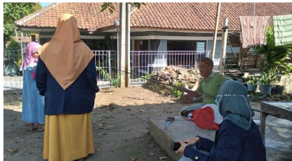
Gambar 1. Refleksi sosial di lingkungan masyarakat

Tahapan awal pelaksanaan kegiatan adalah Refleksi Sosial ( social reflection ). Refleksi Sosial ( social reflection ) merupakan suatu proses interaksi yang dilakukan oleh kelompok masyarakat untuk membaca tentang konsep dan identitas diri kelompok masyarakat tersebut dengan ekspektasi teridentifikasinya kebutuhan, masalah, potensi, dan atau asset kelompok masyarakat. Fokus permasalahan dalam artikel ini adalah pemberdayaan masyarakat dalam bidang pendidikan. Untuk mengidentifikasi permasalahan yang ada di lapangan, maka dilakukan wawancara dengan beberapa warga setempat mengenai sistem pembelajaran di masa pandemi Covid-19 yang disebut dengan istilah pembelajaran Daring. Tahapan ini dilakukan pada minggu pertama 4 Agustus 2021 di dusun Cicelot. Beberapa siswa dan orang tua mengatakan bahwa kegiatan pembelajaran daring kurang efektif dan cenderung membosankan sehingga menghambat motivasi dan minat belajar siswa. Kebijakan pembelajaran daring tidak hanya berdampak pada lembaga pendidikan formal, tetapi juga pada lembaga pendidikan keagamaan sehingga pengetahuan ilmu agama pun menjadi terhambat terutama pada anak usia dini.