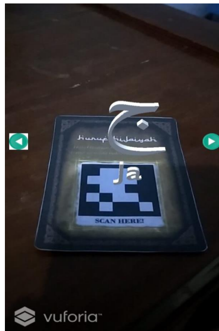
Gambar 7. Hasil pindai kartu pada aplikasi

Tahap keempat merupakan tahap pelaksanaan program berupa sosialisasi aplikasi islami berbasis tiga dimensi yang berisi materi dasar keagamaan, meliputi rukun islam, do'a sehari-hari, dan huruf hijaiyah. Sosialisasi ini diikuti oleh 12 orang yang terdiri dari siswa dan orangtua siswa. Pada tahap ini, disampaikan gambaran isi aplikasi, cara mengunduh dan memasang aplikasi, serta cara menggunakannya. Proses mengunduh dan memasang aplikasi pada smartphone masing-masing dibantu oleh tim KKN-DR SISDAMAS sehingga peserta tidak kebingungan. Peserta terlihat antusias untuk segera menggunakan aplikasi tersebut. Hal tersebut diperkuat dengan adanya survei mengenai aplikasi yang diisi oleh para peserta sosialisasi. Pertanyaan survei yang diajukan serta jawaban dapat dilihat dalam tabel 1.