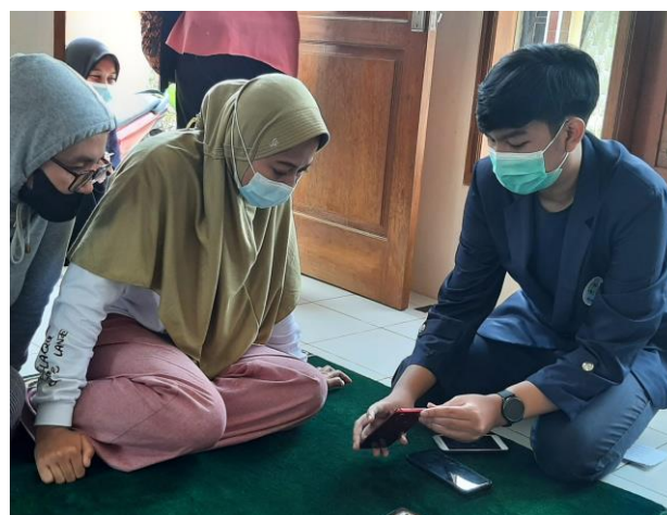
Gambar 5. Memberi arahan pemasangan dan penggunaan aplikasi