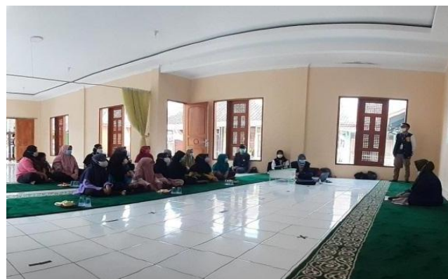
Gambar 4. Sosialisasi aplikasi islami

Tahapan terakhir dari pelaksanaan kegiatan adalah Pelaksanaan Program ( action ). Pelaksanaan Program ( action ) merupakan tahapan inti dari pelaksanaan kegiatan dan semua pihak yang terlibat melaksanakan tugas dan fungsinya masing-masing. Demi terealisasinya program aplikasi islami berbasis AR maka pada tanggal 24 Agustus 2021 diselenggarakan sosialisasi di Masjid Al-Barokah dusun Cicelot desa Cisarua dengan selalu memperhatikan protokol kesehatan (prokes).