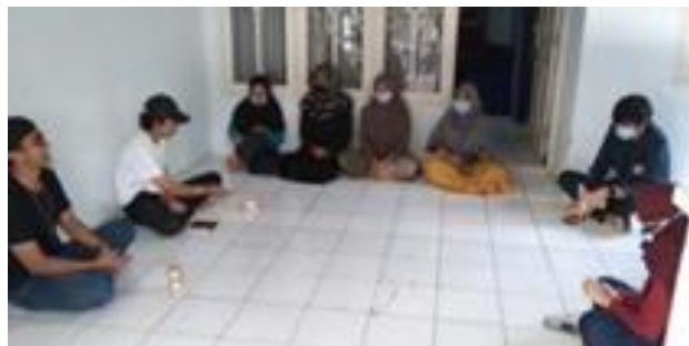
Gambar 2. Diskusi dengan karang taruna

Pada tahapan social mapping & community organizing dilakukan pemilihan organisasi atau kelompok masyarakat yang akan menjadi motor penggerak dalam pelaksanaan pemberdayaan masyarakat. Berkaca dari sosialisasi awal yang sudah dilakukan, kami memutuskan bekerja sama dengan Karang Taruna Desa Cisarua untuk memfasilitasi masyarakat dalam bidang pendidikan.