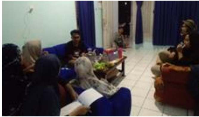
Gambar 3. Diskusi pembuatan aplikasi

Tahapan terakhir dari pelaksanaan kegiatan adalah Pelaksanaan Program ( action ). Pelaksanaan Program ( action ) merupakan tahapan inti dari pelaksanaan kegiatan dan semua pihak yang terlibat melaksanakan tugas dan fungsinya masing-masing. Demi terealisasinya program aplikasi islami berbasis AR maka pada tanggal 24 Agustus 2021 diselenggarakan sosialisasi di Masjid Al-Barokah dusun Cicelot desa Cisarua dengan selalu memperhatikan protokol kesehatan (prokes).