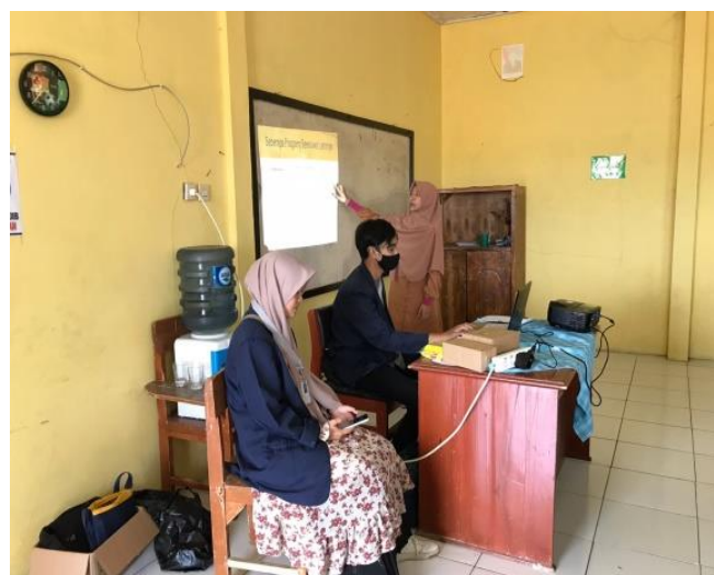
Gambar 4. Pemateri menyampaikan materi yang telah dipersiapkan