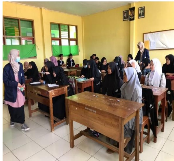
Gambar 3. Siswa dan panitia mempersiapkan menjelang acara dibuka.

Kegiatan ini diawali pada pukul 10.00 pagi. Dengan pemateri terdiri dari 3 orang yaitu: Putri Ika Fadhillah Tumanggor, Salwa Zakiyah Ruhma dan Allif Dzulfikar. Materi pertama yaitu membahas mengenai life plan atau rencana hidup. Rencana hidup adalah usaha-usaha yang dilakukan untuk mewujudkan rencana hidup yang diinginkan dan mengupayakan hal-hal untuk dapat mengatasi kegagalan yang akan dihadapi. Life plan meliputi target apa saja yang harus dicapai, serta batasan waktu kapan harus tercapai.