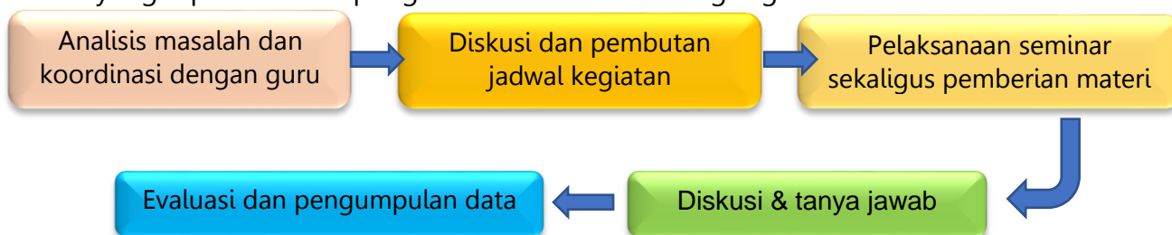
Gambar 2. Tahapan Pelaksanaan Kegiatan

Tahap selanjutnya yaitu tahap pelaksanaan. Dalam tahap ini pelaksanaan rangkaian kegiatan seminar mengenai Bimbingan Karir yang dipandu oleh para peserta KKN DR SISDAMAS UIN Sunan Gunung Djati Bandung. Tahap terakhir yaitu tahap evaluasi. Pada tahap ini melakukan evaluasi terhadap hasil yang dicapai dari kegiatan seminar Bimbingan Karir. Evaluasi dilakukan dengan mengumpulkan data yang diperoleh dari pengisian kuisisioner melalui google form.