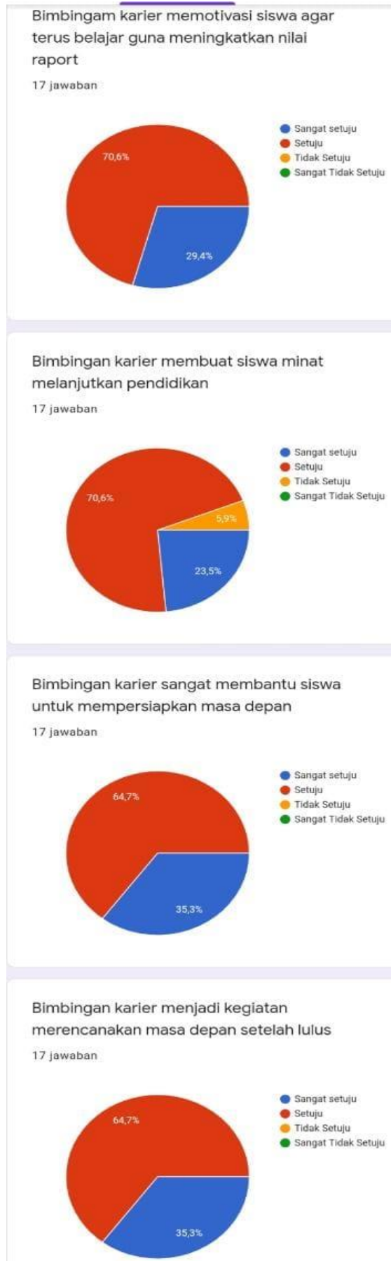
Gambar 6. Hasil survey 17 orang kelas XII MA Miftahul Falah Assidqiyah