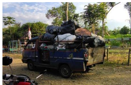
Gambar 6. Penjualan sampah yang bernilai ekonomis

Tahap 3: membangun Relasi Berupa Pertemuan dengan Aparat Desa Hantakan dan Dinas Lingkungan Hidup