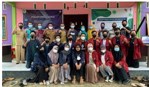
Gambar 9. Membangun relasi antara Desa Hantakan Dengan DLH Hulu Sungai Tengah dalam pengelolaan sampah & Bank Sampah

Hasil dari Pertemuan dengan dinas lingkungan hidup dan aparat desa, ketua rtt, bpd beserta ibu2 pkk berjalan lancar dengan terjalinnya hubungan kerjasama lanjut antara desa hantakan dengan DLH maka program bank sampah bias terwujud dan berjalan didesa hantakan , Berupa penyetoran sampah yang sudah tidak bisa dijual kepada dinas lingkungan hidup sebagai jaminan agar terus berjalannya program bank sampah didesa hantakan. Dan juga ada rencana lanjutan untuk pengadaan hibah kontainer sampah kedepannya dari Dinas Lingkungan Hidup kabupaten hulu sungai tengah untuk desa hantakan yang rencannya akan ditempatkan didekat ponpes Raudhatul ulum dekat desa atau disekitaran tps yang sudah ada dan perencanaan pengangkutan sampah yang semula sampah desa pagat akan berlanjut kedesa hantakan.