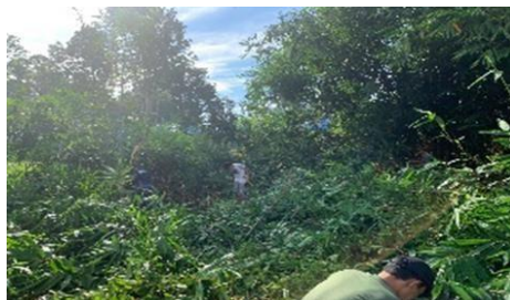
Gambar 2. Pembukaan lahan untuk TPS dan Bank Sampah

Kemudian juga dilakukan kegiatan gotong royong untuk pembukaan lahan dan tempat pembuangan sementara dan bank sampah. dengan luas tanah 10 x 6 meter persegi. Laku tahapan selanjutnya ialah membuat struktur organisasi bank sampah Desa Hantakan dan pembagian trash bag atau kantong sampah kepada tiap RT.