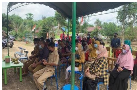
Gambar 7. Pertemuan masyarakat desa Hantakan dengan Dinas Lingkungan Hidup

Dalam pembagian hasil penjualan sampah disisihkan untuk operasional bank sampah dan pengembangan ke Lembaga depan. Bagi hasil di tentukan dengan kesepakatan antara nasabah dan pengelola bank sampah. Pembagian hasil biasanya berkisaran antara 10% - 30% dari nilai penjualan sampah.