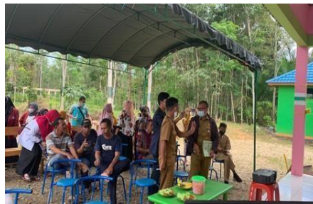
Gambar 1. Pelaksanaan Penyuluhan Bank Sampah Oleh DLH Hulu Sungai Tengah

menyampaikan maksud perencanaan merintis program bank sampah di Desa Hantakan, kepada Dinas Lingkungan Hidup juga meminta izin untuk menjadi narasumber pada acara penyuluhan Bank sampah dan sistem pengelolaan sampah Kepada masyarakat Desa Hantakan. Pengenalan bank sampah kepada masyarakat dengan menjelaskan tentang fungsi bank sampah, cara memilah sampah yang benar dan keuntungan bank sampah merupakan langkah awal edukasi kepada masyarakat. Edukasi dilakukan langsung oleh DLH kabupaten Hulu Sungai Tengah dengan memberikan penjelasan kepada masyarakat bertepatan di Depan gedung posyandu dan perpustakaan Bina Ilmu Desa Hantakan dan dihadiri oleh apratur Desa, ibu-ibu PKK, Wakil Ketua BPD, Para ketua Rt dari Kertan 1 sampai ke rtan 5 juga warga desa hantakan.