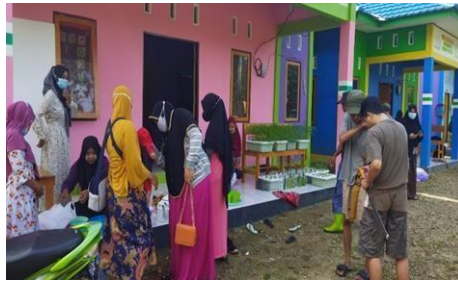
Gambar 5. Proses penimbangan, pemilahan, dan penjualan

Indikator dari hasil pelaksanaan pengumpulan dan penyetoran sampah secara tidak langsung telah menumbuhkan Kesadaran dan gaya hidup masyarakat tentang pengelolaan sampah merubah pola individual penanganan sampah rumah tangga dengan cara dibakar, dikubur, atau dibuang secara langsung kealuran air atau sungai menjadi leboh terkelola perubahan paradigma mengenai sampah yang mulanya adalah kumpul, angkut dan buang menjadi pengurangan, pemanfaatan kembali dan daur ulang atau yang dikenal dengan prinsip 3R (Reduce, Reuse, dan Recycle) Total sampah yang terkumpul dari 5 ke Rtan adalah 221 kg sampah dengan uang yangdidapat sebesar 351 ribu rupiah.