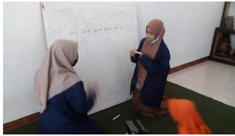
Gambar 2. Les Private "Membaca"

Gambar 2 menunjukkan pelaksanaan program les private dengan pendalaman materi membaca pada anak-anak tingkat SD. Pemateri menuliskan sebuah kalimat, kemudian dibacakan oleh anak-anak yang hadir satu persatu.