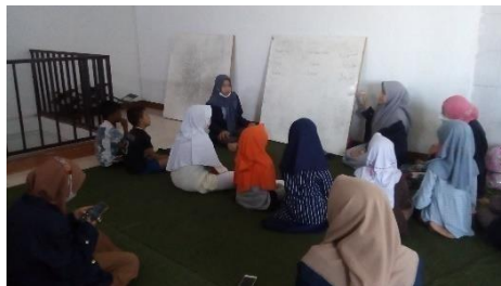
Gambar 3. Les Private "Menulis"

Gambar 2 menunjukkan pelaksanaan program les private dengan pendalaman materi membaca pada anak-anak tingkat SD. Pemateri menuliskan sebuah kalimat, kemudian dibacakan oleh anak-anak yang hadir satu persatu.