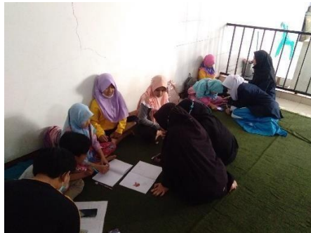
Gambar 1. Tutor dan Siswa SD - Pendampingan PJJ dengan metode pengelompokkan

Gambar 1 menunjukkan aktivitas tutor yang sedang mendampingi Siswa tingkat SD dalam proses Pembelajaran Jarak Jauh (PJJ). Posisi dalam foto merupakan gambaran pembagian kelompok dalam pelaksanaan PJJ tersebut. Pendampingan bertujuan untuk membantu anak-anak dalam mengerjakan tugas yang diberikan oleh pihak sekolah. Tutor memberikan arahan untuk mengerjakan soal tersebut sehingga tidak hanya mengerjakan soal, tetapi materi dari soal yang dikerjakan sedikit banyaknya dapat difahami oleh anak-anak tersebut.