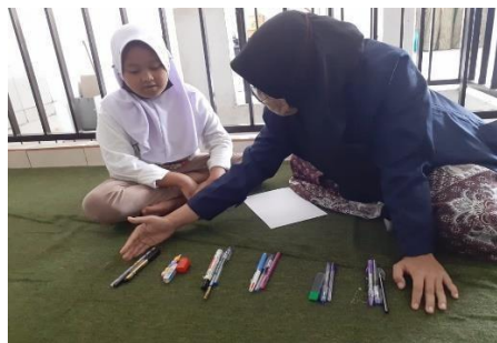
Gambar 4. Les Private "Berhitung"

Gambar 3 menunjukkan pelaksanaan les private pada anak-anak tingkat SD dengan pendalaman materi menulis. Pemateri menuliskan beberapa kata/kalimat kemudian ditulis ulang oleh anak-anak. Setelah itu, pemateri dan peserta KKN lainnya mengecek ketepatan penulisannya, seperti jarak antar kalimat dan yang lainnya.