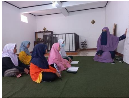
Gambar 5. Les Private “Bahasa Asing”

Gambar 5. Menunjukkan pelaksanaan Les Private Bahasa Asing, yaitu Bahasa Arab dan Inggris. Pemateri menuliskan materi dasar berupa kosa kata umum/familiar dengan menggunakan tiga bahasa sekaligus (Bahasa Indonesia, Bahasa Arab, Bahasa Inggris). Kemudian dihafalkan secara bersama-sama.