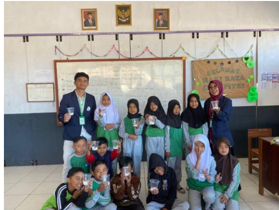
Gambar 1. Eksperimen Perkecambahan Biji

Dalam hasil eksperimen tersebut, siswa dapat mengetahui bagaimana proses perkecambahan biji dalam perlakuan yang berbeda yaitu gelap dan terang. Tanaman yang diletakkan ditempat yang gelap pertumbuhan tanamannya sangat cepat selain itu tekstur dari batangnya sangat lemah dan cenderung warnanya pucat kekuningan. Hal ini disebabkan karena kerja hormon auksin tidak dihambat oleh sinar matahari. Sedangkan untuk tanaman yang diletakkan ditempat yang terang tingkat pertumbuhannya sedikit lebih lambat dibandingkan dengan tanaman yang diletakkan ditempat gelap, tetapi tekstur batangnya sangat kuat dan juga warnanya segar kehijauan, hal ini disebabkan karena kerja hormon auksin dihambat oleh sinar matahari.