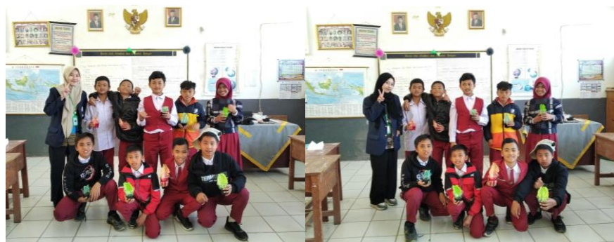
Gambar 3. Eksperimen Transportasi Tumbuhan

Metode pembelajaran dengan ceramah masih digunakan di SDN Rancabali. Metode tersebut membuat para murid belajar mata pelajaran IPA kurang memahami secara mendalam materi yang diajarkan. Terlebih lagi keterbatasan waktu dan pemberian materi yang banyak karena mengejar target kurikulum salah satu penyebab ketidaktuntasan belajar para murid terjadi. Pembelajaran dengan cara tersebut tidak dapat mendorong semua murid berpikir kritis, tidak aktif, menimbulkan rasa bosan, dan berpikir belajar sangat sulit karena banyak konsep-konsep abstrak yang harus dipahami. Sehingga adanya metode eksperimen dapat membantu murid melaksanakan percobaan dan mempraktekkan materi pelajaran IPA secara langsung agar lebih mengerti dan bermakna. Pada tanggal 16 Agustus 2023 telah dilaksanakan salah program kerja Eksperimen Sains Biologi mengenai Transportasi pada Tumbuhan. Dimana target pada kelas 6 SDN Rancabali dengan siswa berjumlah 9 orang terdiri 8 laki-laki dan 1 perempuan. Penerapan metode eksperimen pada pelajaran IPA tentang transpotasi tumbuhan dalam materi struktur dan fungsi bagian tumbuhan. Pembelajaran dimulai dengan pemaparan materi oleh mahasiswa dengan sistem mengambar bagian-bagian tumbuhan dan fungsinya, proses trasnportasi, dan jaringan-jaringan pada tumbuhan. Setelah pemaparan semua murid diberikan pre-test mengenai materi terkait.