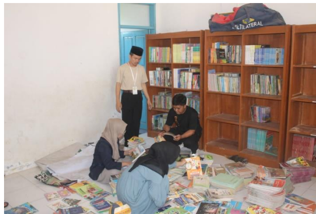
Gambar 6. Menyusun Bahan Pustaka