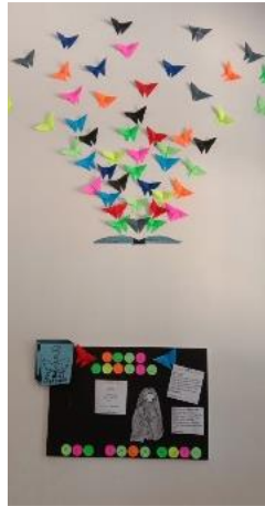
Gambar 11. Tampilan Dekorasi Hiasan Dinding