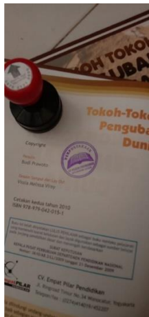
Gambar 11. Stempel Perpustakaan SDN Pasir Sereh

Berdasarkan gambar revitalisasi perpustakaan seperti yang terlihat pada gambar di atas, perpustakaan sekolah yang sebelumnya belum digunakan oleh sekolah dengan baik, setelah mengalami proses revitalisasi, tampak lebih teratur dengan buku-buku yang disusun dengan baik. Selain itu, adanya dekorasi yang menarik, serta buku kunjungan, diharapkan dapat menggugah minat siswa untuk lebih aktif dalam membaca. Ini akan membantu siswa dalam mengakses informasi yang lebih melimpah dan bermanfaat.