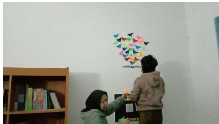
Gambar 9. Mendekorasi Ruang Baca

Selanjutnya, hasil revitalisasi perpustakaan SDN Pasirsereh disajikan pada Gambar 10, 11, dan 12