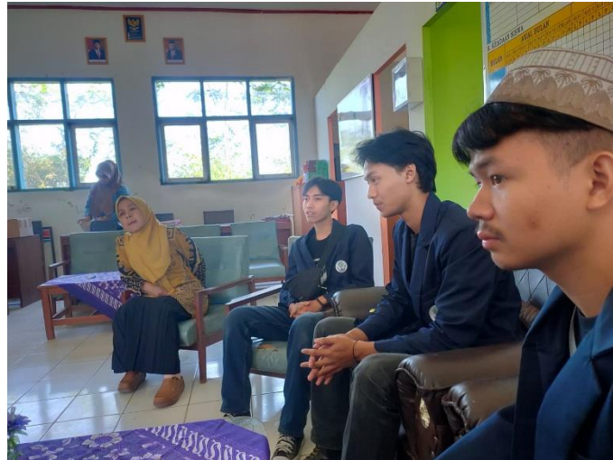
Gambar 2. Observasi dan Wawancara Untuk Mengidentifikasi Masalah

Oleh karena itu, kami menyimpulkan bahwa perpustakaan SDN Pasirsereh memerlukan perhatian khusus dan perlu dilakukan revitalisasi. Revitalisasi ini akan berfokus pada upaya mendekorasi ulang perpustakaan, menambah koleksi buku, dan mengatur penyusunan buku sesuai dengan jenisnya. Rencana revitalisasi selanjutnya akan dikonsultasikan dengan kepala sekolah, guru, serta Dosen Pembimbing Lapangan (DPL) dari KKN Sisdamas Desa Mukapayung.