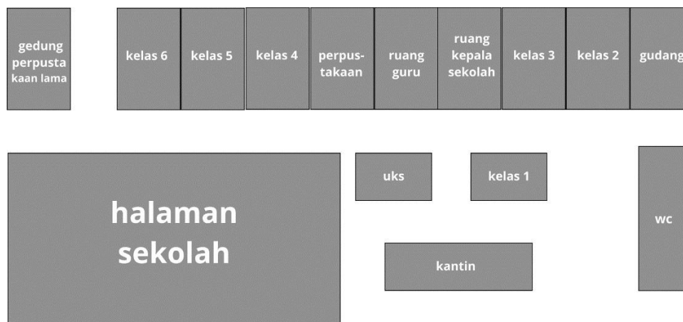
Gambar 1.2 Ilustrasi Denah Sekolah SDN Pasir Sereh