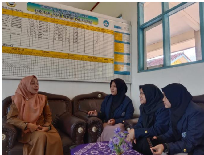
Gambar 1. Silaturahmi dan Kunjungan Awal

Pada tahap awal pelaksanaan program KKN Sisdamas kelompok 234 di Desa Mukapayung, tim kami melakukan wawancara dengan kepala sekolah dan guru-guru di SDN Pasirsereh serta melakukan observasi sebagai langkah pendahuluan. Berdasarkan hasil wawancara yang kami lakukan pada tanggal 20 Juli 2023, kami memperoleh informasi bahwa perpustakaan sekolah belum digunakan kembali sejak pandemi Covid-19. Awalnya, sekolah ini memiliki gedung perpustakaan yang tersendiri karena adanya perubahan kurikulum yang mengakibatkan peningkatan jumlah buku dan peralatan yang diperlukan. Oleh karena itu, diperlukan ruangan perpustakaan tambahan yang kemudian disiapkan di gedung yang berdekatan dengan ruang sekolah dan kantor. Gedung perpustakaan yang lama telah diubah menjadi gudang, sementara ruangan baru tersebut telah diatur sedemikian rupa sebagai sarana literasi yang tertata dengan baik dan mudah diakses. Selain itu, kami juga mengetahui bahwa tidak ada staf yang secara khusus bertanggung jawab dalam pengelolaan perpustakaan. Selama observasi kami, perpustakaan belum tersusun dengan baik dan masih digunakan untuk menyimpan alat-alat olahraga dan perlengkapan kebersihan.