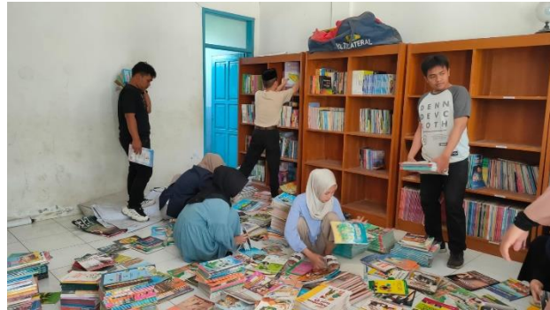
Gambar 5. Menyortir Bahan Pustaka