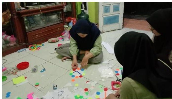
Gambar 7. Mempersiapkan Dekorasi Hiasan Dinding Perpustakaan