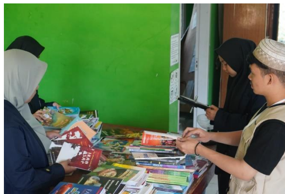
Gambar 4. Mengklasifikasikan Bahan Pustaka

Proses revitalisasi perpustakaan oleh Tim KKN Sisdamas kelompok 234 Desa Mukapayung 2023 dapat dilihat pada Gambar 4, 5, 6, 7, 8, dan 9.