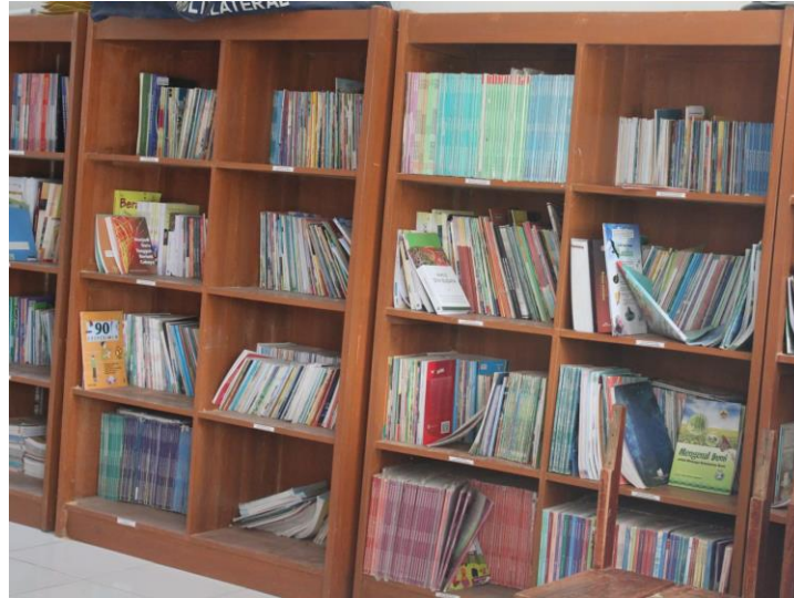
Gambar 3. Perpustakaan Sebelum di Revitalisasi

Kondisi perpustakaan sebelum direvitalisasi dapat dilihat pada Gambar 3.