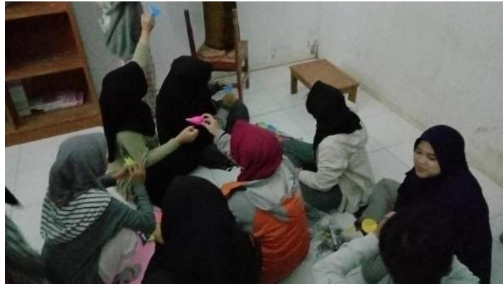
Gambar 8. Mendekorasi Perpustakaan