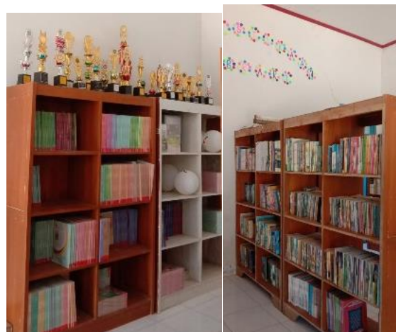
Gambar 10. Perpustakaan setelah di Revitalisasi

Selanjutnya, hasil revitalisasi perpustakaan SDN Pasirsereh disajikan pada Gambar 10, 11, dan 12