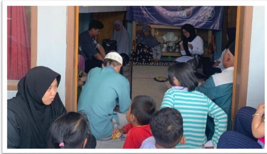
Gambar 6 Pelaksanaan penyuluhan sadar hukum

Action Pelaksanaan program kegiatan penyuluhan sadar hukum sesuai dengan kebutuhan masyarakat. Program ini dilaksanakan tanggal 14 Agustus 2023. Proses pelaksanaan siklus IV ini dilaksanakan di rumah tokoh masyarakat dengan judul penyuluhan “Edukasi Legalitas Lahan Tanah Di Kawasan Cikondang” dihadiri oleh 20 orang masyarakat yang didalamnya terdapat sesi tanya jawab.