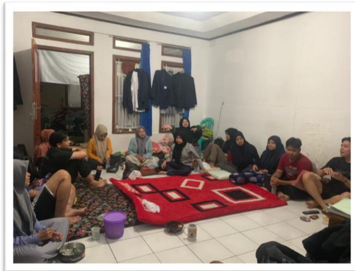
Gambar 4 Diskusi bersama kelompok 192 membicarakan rencana kedepan dari permasalahan di kawasan Cikondang

Participation Planning merupakan perencanaan yang didalamnya kepentingan masyarakat, sebelumnya didapatkan pada tahap refleksi sosial/pemetaan sosial memakai teknik transect dan penyusunan sehingga menjadi program kegiatan yang disepakati Bersama masyarakat. Permasalahan yang kami dapat di siklus II yaitu masyarakat di Kampung Cikondang dengan mudah menjualnya ke proyek dan tak sedikit tanah di Cikondang tidak berkekuatan hukum. Adanya hal tersebut kami berinisiatif untuk membuat acara penyuluhan sadar hukum agar masyarakat sadar bahwa legalitas lahan itu penting.