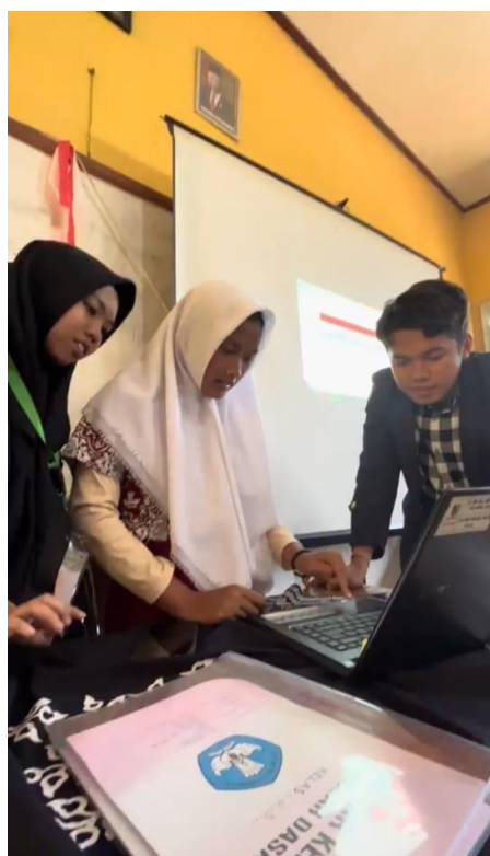
Gambar 7. Praktik Microsoft Word

Setelah semua materi disampaikan kepada para siswa, kami meminta para siswa untuk melakukan praktek langsung