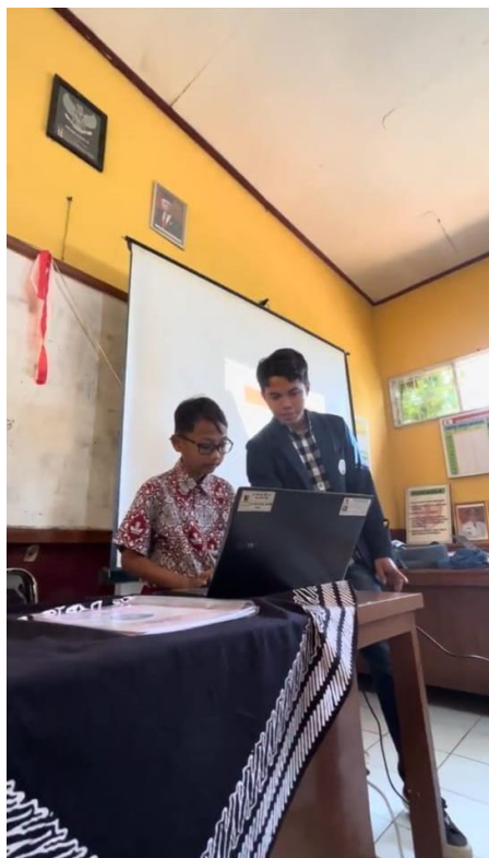
Gambar 6. Praktik Microsoft Word