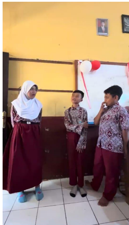
Gambar 3. Ice Breaking