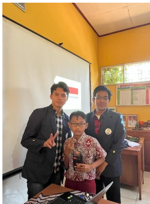
Gambar 8. Pemberian Hadiah

Microsoft Word pada laptop. Hal ini dilakukan agar para siswa terbiasa menggunakan Microsoft Word. Karena pembelajaran tentang komputer lebih baik dilakukan dengan praktik agar terbiasa dan mudah diingat. Dengan contoh ini, anak-anak pun semoga menjadi terbiasa untuk mempraktekan hal yang baru dipelajarinya sehingga tidak hanya paham secara teori namun dapat mempraktekan secara langsung.