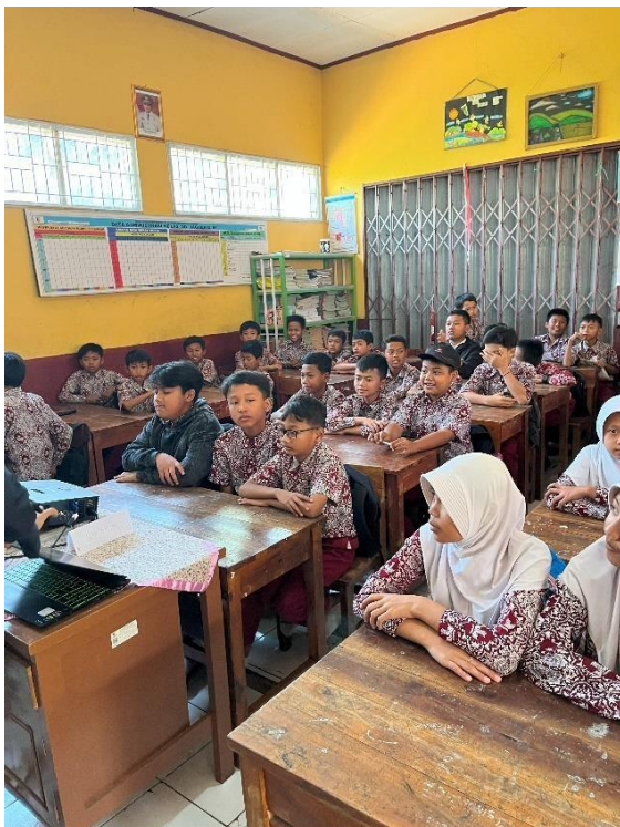
Gambar 1. Kondisi Kelas Sebelum Memulai Materi

Mengumpulkan anak kelas 6 SDN 01 Jagabaya menjadi satu kelas, agar