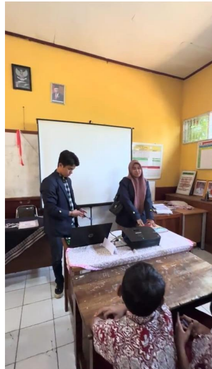
Gambar 2. Ice Breaking

memudahkan dalam penyampaian materi tentang Microsoft Word.