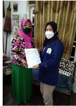
Gambar 1.5. Penyerahan Laporan