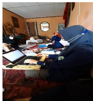
Gambar 1.4. Pembuatan Laporan Posyandu

Kemudian pada tanggal 20 Agustus 2021, mahasiswa melakukan pembuatan laporan dari hasil pendataan kegiatan. Laporan terdiri dari laporan F1 gizi, laporan SDIDTK, dan laporan hasil kegiatan. Pembuatan laporan dilakukan di rumah ibu ketua POSYANDU dan dihadiri para kader POSYANDU. Kemudian pada tanggal 23 Agustus 2021, laporan telah di finalisasi oleh mahasiswa dan laporan akan diserahkan kepada ibu ketua POSYANDU pada keesokan harinya yaitu pada tanggal 24 Agustus 2021.