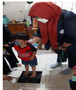
Gambar 1.2. Pemberian Vitamin A Gambar1.3. Penimbangan Berat badan

Kemudian pada tanggal 20 Agustus 2021, mahasiswa melakukan pembuatan laporan dari hasil pendataan kegiatan. Laporan terdiri dari laporan F1 gizi, laporan SDIDTK, dan laporan hasil kegiatan. Pembuatan laporan dilakukan di rumah ibu ketua POSYANDU dan dihadiri para kader POSYANDU. Kemudian pada tanggal 23 Agustus 2021, laporan telah di finalisasi oleh mahasiswa dan laporan akan diserahkan kepada ibu ketua POSYANDU pada keesokan harinya yaitu pada tanggal 24 Agustus 2021.