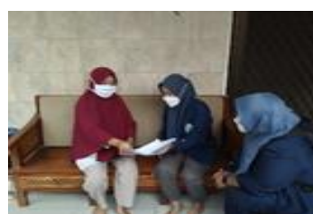
Gambar 1.1. Perizinan pelaksanaan KKN bersama ibu RW dan Ketua Posyandu