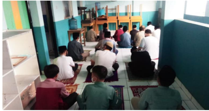
Gambar 2. Shalat dhuha saat kegiatan offline di pagi hari sebelum memulai pembelajaran.