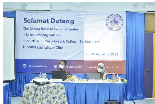
Gambar 3. Bersama tim asesor dalam kegiatan akreditasi sekolah

Karena sekolah baru berdiri 3 tahun maka kegiatan akreditasi di selenggarakan tahun ini dan kebetulan kami ikut membantu dalam menyiapkan kegiatan tersebut.