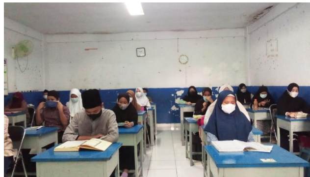
Gambar 5 b . Mengadakan pembelajaran tatap muka secara bertahap dengan menerapkan protokol kesehatan.