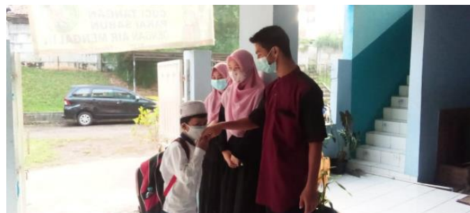
Gambar 6. Menyambut anak yang mengikuti kegiatan tatap muka secara bertahap

Dalam mengikuti kegiatan kami menerapkan protocol kesehatan dan beberapa kegiatan yang kami ikuti seperti : piket kelas untuk menyambut siswa yang offline dan menertibkannya, menghadiri rapat guru, dan menyiapkan dokumen administrasi bagi guru bidang, dll.