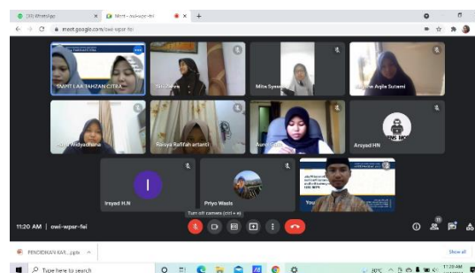
Gambar 4 . mengikuti kegiatan MPLS secara Daring

Dengan masuknya tahun ajaran baru di sekolah, maka sekolah membuat kegiatan MPLS atau biasa disebut masa pengenala lingkungan sekolah yang diadakan secara online.