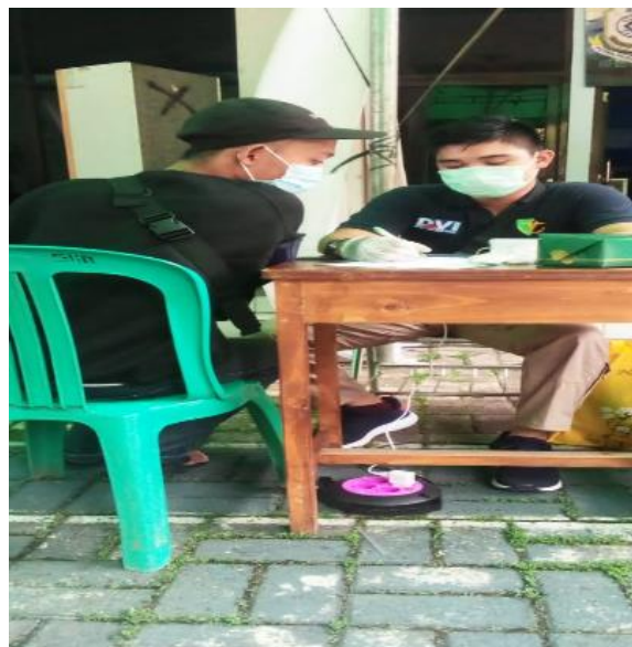
Gambar 1. Proses kegiatan penerimaan vaksinasi bagi guru dan siswa di SMK PPI

Upaya di selenggarakan pembelajaran tatap muka, maka sekolah mewajibkan guru dan siswa untuk melakukan vaksinasi baik secara mandiri maupun yang diadakan oleh sekolah.