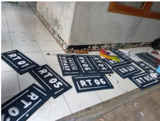
Gambar 9. Papan nama yang telah siap

Tahap terakhir pada proses pembuatan papan nama pembatas adalah penyambungan. Tahap penyambungan ini merupakan tahap dimana bamboo serta papan triplek yang telah disiapkan disatukan agar menjadi suatu papan nama pembatas sesuai dengan desain. Digunakan 3 buah paku untuk menyambungkan antara triplek dengan bamboo. Posisi triplek berada diatas sehingga papan nama menyerupai huruf T.