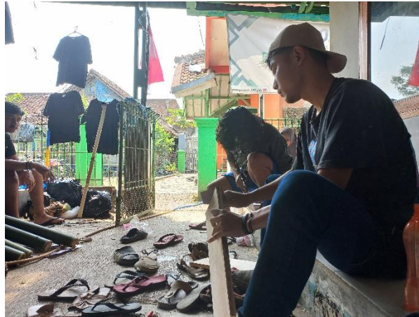
Gambar 5. Proses pengamplasan

Proses selanjutnya adalah pengecatan. Cat yang digunakan untuk menjadi warna dasar pada bamboo dan triplek adalah biru tua. Warna tersebut didapatkan dengan mencampur warna hitam serta biru muda. Cat yang digunakan adalah cat kayu dengan merk Avian. Tinner ditambahkan pada campuran cat agar menghasilkan kualitas cat yang baik. Seluruh bagian bamboo dan triplek di cat menjadi warna biru tua. Proses pengeringan cat dilakukan di bawah terik matahari agar lebih efektif.