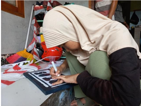
Gambar 8. Proses pengecatan desain papan nama

Setelah proses pengecatan warna dasar, langkah selanjutnya adalah pengecatan tulisan pada setiap papan nama yang telah disiapkan. Warna cat yang disiapkan untuk tulisan adalah putih. Warna tersebut dipilih agar dapat terlihat jelas, mengingat warna dasar yang digunakan adalah warna biru tua. Tahap akhir pada proses pengecatan adalah pemberian vernis pada seluruh permukaan triplek dan bamboo. Vernis diperlukan agar warna cat terlihat lebih bagus dan jernih.