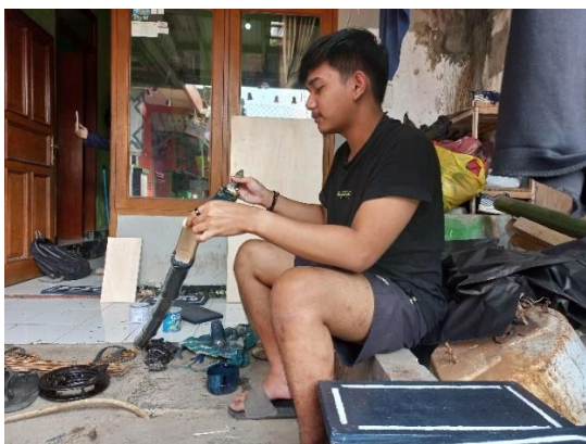
Gambar 7. Proses pengecatan warna dasar bambu