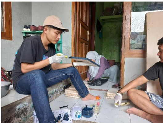
Gambar 6. Proses pengecatan warna dasar triplek

Proses selanjutnya adalah pengecatan. Cat yang digunakan untuk menjadi warna dasar pada bamboo dan triplek adalah biru tua. Warna tersebut didapatkan dengan mencampur warna hitam serta biru muda. Cat yang digunakan adalah cat kayu dengan merk Avian. Tinner ditambahkan pada campuran cat agar menghasilkan kualitas cat yang baik. Seluruh bagian bamboo dan triplek di cat menjadi warna biru tua. Proses pengeringan cat dilakukan di bawah terik matahari agar lebih efektif.