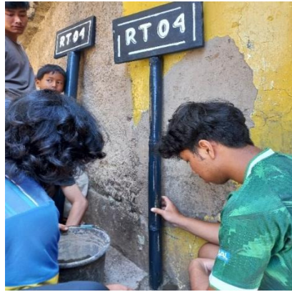
Gambar 10. Proses pemasangan papan nama

Pelaksanaan pembuatan serta pemasangan papan nama pembatas dibutuhkan waktu sekitar 1 minggu. Pada waktu tersebut digunakan untuk menentukan titik penyimpanan papan nama, persiapan alat dan bahan, pembuatan serta pemasangan.