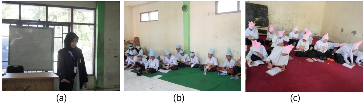
Gambar 2. Pada (a), (b), (c) merupakan kegiatan hari kedua MPLS

Pada hari kedua yaitu disampaikannya materi kelas kebangsaan untuk para siswa agar senantiasa dapat memahami serta dapat menghgamalkan nilai-nilai kebangsaan pada kehidupan sehari-hari. Melalui wawasan kebangsaan diharapkan dapat menanamkan rasa cinta tanah air dan menjaga kebhinekaan agar tetap rukun dan damai dalam bermasyarakat.