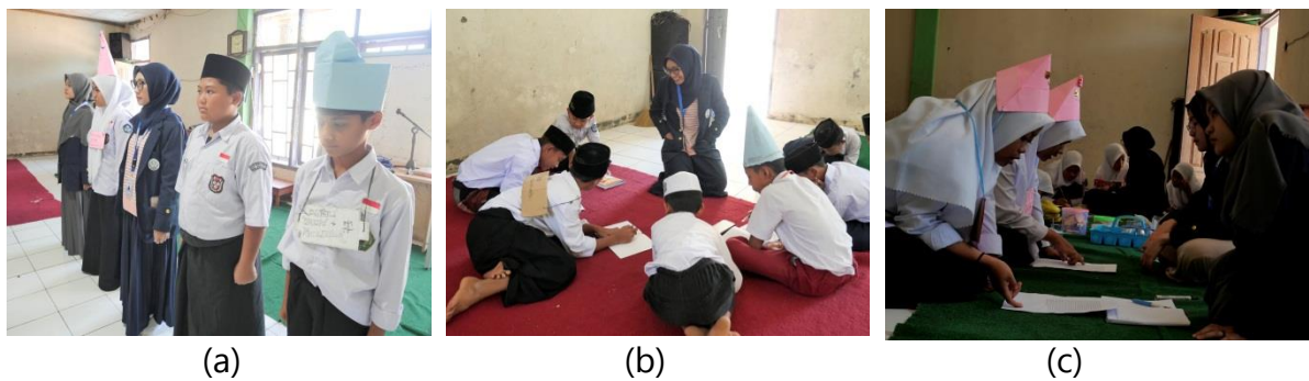
Gambar 2. Pada (a), (b), (c) merupakan kegiatan hari ketiga MPLS

Pada hari kedua yaitu disampaikannya materi kelas kebangsaan untuk para siswa agar senantiasa dapat memahami serta dapat menghgamalkan nilai-nilai kebangsaan pada kehidupan sehari-hari. Melalui wawasan kebangsaan diharapkan dapat menanamkan rasa cinta tanah air dan menjaga kebhinekaan agar tetap rukun dan damai dalam bermasyarakat.