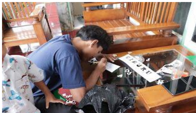
Gambar 2 mengukir nama-nama jalan untuk ditulis di marka jalan

Selain membuat marka jalan, pada hari selasa tersebut juga kelompok 80 mempersiapkan serta membuat nomor rumah untuk RW 07 dan langsung dipasang ke tiap rumah yang ada di RW 07 oleh kelompok 80 yang dibantu oleh masyarakat RW 07 di Desa Sukamaju.