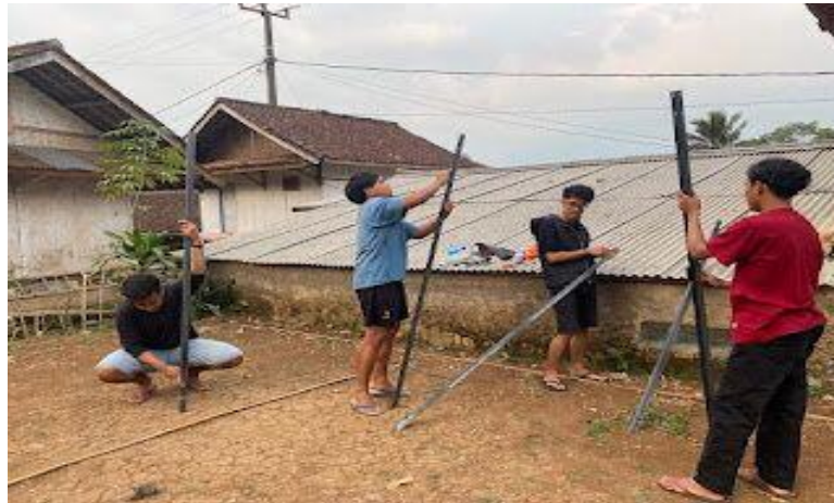
Gambar 1 menghampelas besi sebelum di cat untuk pembuatan marka jalan

nama jalan yang ada di RW 07,08, dan 09 pada marka tersebut yang akan menjadi panduan bagi pengendara yang ada di Desa Sukamaju.