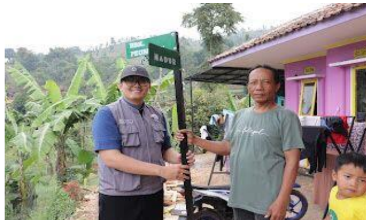
Gambar 4 Menyerahkan marka jalan kepada ketua RW 07

Pada hari Jumat 18 Agustus 2023, setelah semua proses pembuatan marka jalan selesai, kelompok 80 meyerahkan marka jalan tersebut kepada kepala RW 07,08, dan 09 supaya marka jalan tersebut segera terpasang di tiap RW tersebut. Semoga dengan adanya marka jalan dan nomor rumah tersebut bermanfaat dan semoga menjadi pemberian yang berkesan bagi warga Desa Sukamaju.