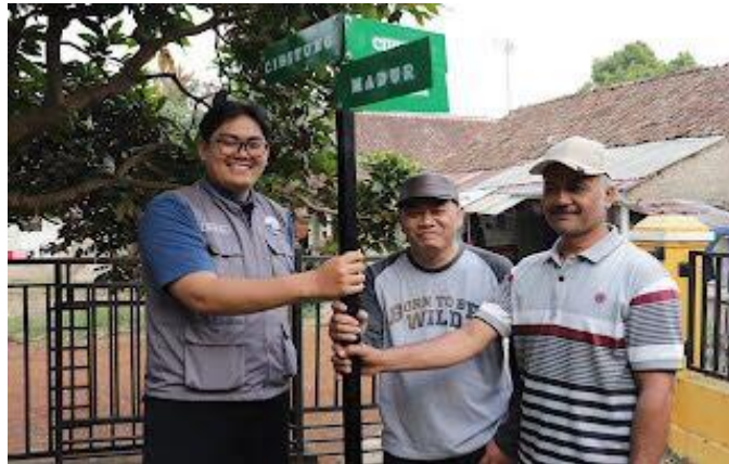
Gambar 6 Menyerahkan marka jalan kepada ketua RW 09