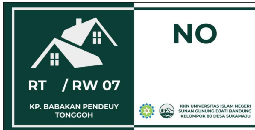
Gambar 7. Desain nomor rumah

Nomor Rumah meliputi pemotongan, pemasangan, penulisan, dan pemakuan. Seng yang sudah dipotong sesuai ukuran lalu dipasang stiker. Lalu setelah itu di tulis Nomor Rumahnya menggunakan Spidol Permanent. Setelah itu Pemakuan Nomor Rumah pada permukaan rumah yang berbahan kayu agar memudahkan menempelnya Nomor Rumahnya.