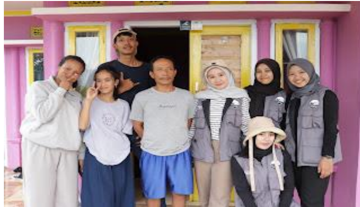
Gambar 3 Menempelkan nomor rumah pada rumah warga RW 07

Pada hari Jumat 18 Agustus 2023, setelah semua proses pembuatan marka jalan selesai, kelompok 80 meyerahkan marka jalan tersebut kepada kepala RW 07,08, dan 09 supaya marka jalan tersebut segera terpasang di tiap RW tersebut. Semoga dengan adanya marka jalan dan nomor rumah tersebut bermanfaat dan semoga menjadi pemberian yang berkesan bagi warga Desa Sukamaju.