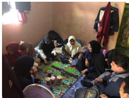
Gambar 4. Perencanaan partisipatif bersama Karang Taruna dan Patriot Desa

Lalu, pada 12 Agustus 2021, program-program tersebut diseleksi sesuai dengan prioritasnya. Adapun program yang akan diluncurkan yaitu pemasaran digital terhadap UMKM Lidi Upin Ipin, program ini dimaksudkan sebagai adaptasi baru bagi UMKM agar bisa bertahan di masa pandemi ini. Selanjutnya, program ini dipecah lagi menjadi beberapa langkah atau disebut sebagai sub-program, yakni; sosialisasi mengenai pemasaran digital, pembuatan media sosial untuk promosi, pembuatan desain serta copywriter untuk promosi, pembuatan timeline serta konsep untuk konten, pendampingan penjualan secara online , dan terakhir adalah sosialisasi mengenai strategi pemasaran online .