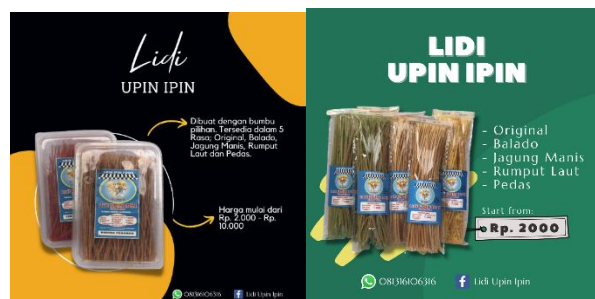
Gambar 7. Poster promosi UMKM

Setelah membuat desain poster promosi dan memfoto produk, pengabdian melanjutkan dengan membuat copywriterr yang berupa caption atau redaksi promosi. Copywriterr berguna untuk meningkatkan efektifitas promosi, sehingga isinya harus menarik, jelas dan juga persuasif, karena digunakan untuk menarik minat pelanggan. Dalam membuat copywriterr untuk UMKM pun tidak dibuat secara asal-asalan, terdapat beberapa hal yang harus diperhatikan. Pertama, pengabdian mempelajari terlebih dahulu produk yang akan dibuat copywriterr nya, karena copywriterr nya ini harus memuat keunikan produk, manfaat produk serta keunggulan produk. Setelah itu, pengabdian juga harus memahami kebutuhan audiens, yaitu dengan membuat naskah copywriterr terlihat 'personal,' misalnya dengan menambahkan embel-embel 'cemilan ini cocok untuk menemani kamu dalam main games , loh!' Karena, target pembelinya pun anak-anak. Selain itu, diksi-diksi yang digunakan pun merupakan diksi yang sederhana dan tidak terlalu kompleks, agar mudah dimengerti oleh para audiens atau calon pembeli. Setelah membuat segala kebutuhan konten, selanjutnya pengabdian memberikan desain poster, foto produk dan copywriterr berupa caption kepada pelaku UMKM.