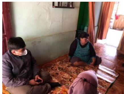
Gambar 5. Sosialisasi mengenai pemasaran digital kepada pelaku UMKM

Adapun sub-informasi yang disampaikan yaitu; apa itu pemasaran secara digital, bagaimana cara kerja pemasaran digital, bagaimana menentukan media dalam memasarkan produk secara online atau digital, apa pentingnya dan manfaatnya memasarkan produk secara online , dan hal-hal yang harus dilakukan pada saat akan terjun ke dalam online marketing , khususnya di media sosial. Informasi-informasi tersebut disampaikan secara lisan, dengan bahasa yang ringan agar pelaku UMKM pun bisa paham dengan mudah mengenai pemasaran digital serta manfaatnya. Setelah mengetahui manfaatnya, diharapkan pelaku UMKM pun bersedia untuk konsisten dalam menjalankan digitalisasi produknya.