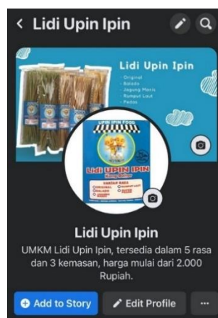
Gambar 6. Media sosial UMKM

Setelah melakukan pertimbangan dan survey, akhirnya diputuskan bahwa media yang paling tepat adalah Facebook, hal ini didasari dengan banyaknya masyarakat sekitar yang menggunakan Facebook, serta target pembeli yang juga menggunakan Facebook, mengingat target pembeli merupakan anak-anak sampai dengan remaja awal, maka media sosial yang banyak digunakan adalah Facebook. Setelah menentukan media yang akan digunakan, selanjutnya pengabdian membuat akun media sosial (Facebook) untuk UMKM Lidi Upin Ipin. Pengabdian melampirkan pula bio, foto profil serta foto header untuk UMKM tersebut, agar para pelanggan UMKM Lidi Upin Ipin mengetahui bahwa UMKM ini kini sudah tersedia secara online . Lalu, pengabdian memberikan akun Facebook tersebut kepada anak dari pelaku UMKM untuk selanjutnya dikelola oleh anak dari pelaku UMKM tersebut.