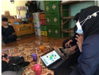
Gambar 10. Sosialisasi strategi pemasaran digital

mungkin, karena konsumen biasanya enggan menunggu lama; terus mengontrol hasil analitik Facebook di setiap postingan; memberikan informasi yang jelas pada setiap produk yang diposting atau dipromosikan; memberikan diskon atau potongan harga kepada konsumen. Strategi-strategi tersebut merupakan strategi yang tidak terlalu kompleks dan masih bisa dilakukan secara rutin oleh pelaku UMKM, karena tidak terlalu memberatkan, hanya dibutuhkan konsistensi saja.