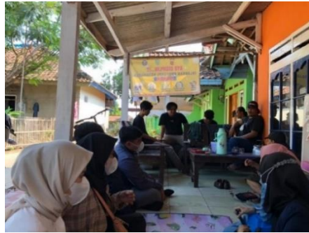
Gambar 3. Melakukan pemetaan sosial bersama Karang Taruna, Patriot Desa dan pelaku UMKM