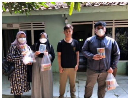
Gambar 2. Koordinasi dengan UMKM Lidi Upin Ipin

Langkah selanjutnya, pengabdian melakukan refleksi sosial dengan pihak UMKM Lidi Upin Ipin. Kegiatan ini dilakukan pada tanggal 5 Agustus 2021. Pada langkah ini, pengabdian berdiskusi dengan pihak UMKM terkait permasalahan-permasalahan yang sedang dihadapi serta harapan-harapan pelaku UMKM untuk usahanya. Dalam kegiatan kali ini, pihak UMKM terlihat cukup senang dengan kehadiran pengabdian, karena nampaknya pandemi ini memberikan dampak yang cukup besar terhadap UMKM Lidi Upin Ipin, kegiatan produksi yang awalnya diadakan selama 3-4 hari sekali, berubah drastis menjadi seminggu sekali. Permasalahan ini cukup berdampak pada pendapatan pelaku UMKM.