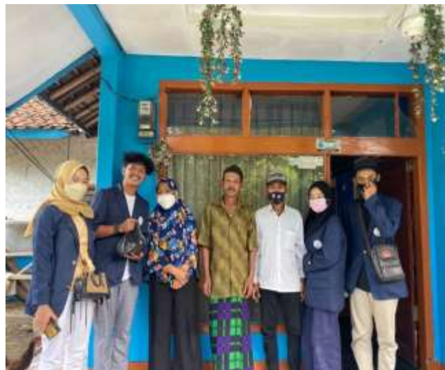
Gambar 4 (Koordinasi dengan Ketua RW)

Koordinasi dengan Ketua RW di desa Jatisari serta memberitahukan program kerja yang penulis bawa untuk mengabdikan diri pada masyarakat. Penulis diterima dengan baik serta diizinkan untuk melaksanakan program kerja pada kegiatan KKN.