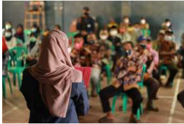
Gambar 5 (Pembukaan KKN-DR di GOR desa Jatisari)