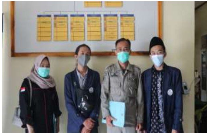
Gambar 3 (Koordinasi dengan pihak kepolisian sebagai satgas covid-19 di polsek cisompet)

Koordinasi dengan pihak kepolisian sebagai satgas covid-19 setempat yang dilaksanakan di kantor polsek Cisompet. Penulis diterima dengan baik dan diizinkan untuk melaksanakan kegiatan KKN.