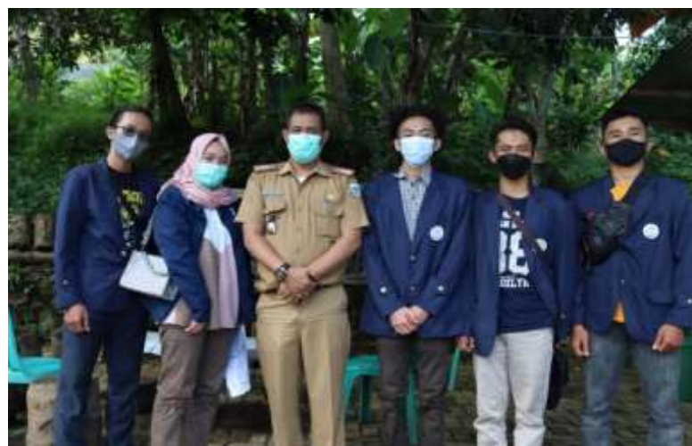
Gambar 2 (Koordinasi dengan Kepala Kecamatan di Kantor Kecamatan Cisompet)

Koordinasi kepada kepala kecamatan Cisompet yang dilaksanakan di kantor kecamatan cisompet. Penulis diterima dengan baik serta mendapatkan izin dari kepala kecamatan untuk melaksanakan kegiatan KKN.