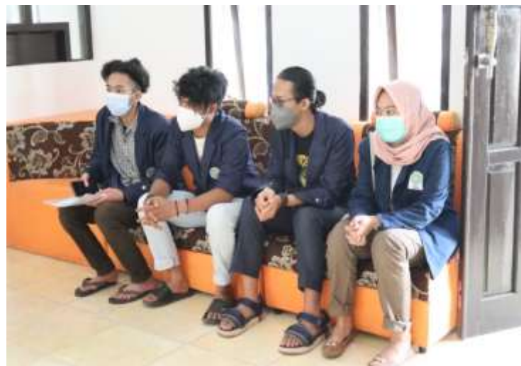
Gambar 1 (koordinasi kepada kepala desa di kantor desa Jatisari)

Koordinasi kepada Kepala Desa dilaksanakan di kantor desa Jatisari. Pada saat perizinan tersebut berlangsung penulis diterima dengan baik oleh kepala desa dan juga mendapatkan izin untuk melaksanakan beberapa program kerja yang akan dilaksanakan selama kegiatan KKN berlangsung.