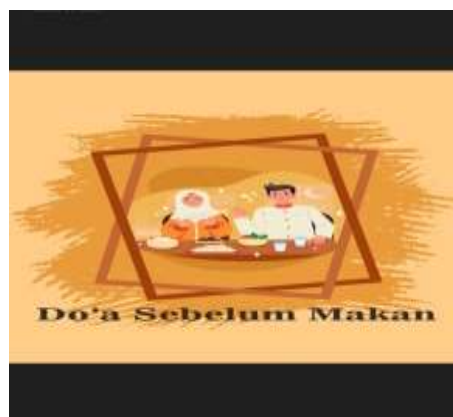
Gambar 9 Barcode Do'a Sebelum Makan

Islam mengajarkan bahwa sebelum berkegiatan manusia harus diawali dengan doa agar diberikan kemudahan serta berkah dalam menjalani aktivitas. Jika tidak tahu doanya minimal kita mengucapkan basmalah sebelum memulai kegiatan serta hamdalah setelah melaksanakan kegiatan. Dalam beberapa kegiatan ada doa khusus sebelum memulainya, seperti doa sebelum belajar, doa setelah belajar, doa hendak makan, doa setelah makan dan lain sebagainya. Peserta didik di madrasah ini telah diajarkan serta dibiasakan untuk berdoa sebelum melaksanakan kegiatan, walaupun demikian dalam pelaksanaannya masih ada peserta didik yang belum terbiasa menggunakan doa-doa tersebut ketika melaksanakan kegiatan, bahkan dibeberapa murid masih ada yang kesulitan untuk menghapalnya. Teknologi augmented reality ini membantu mempermudah pembelajaran serta memudahkan menghafal karena selain memunculkan doanya dalam teknologi ini juga ada gambar 3 dimensi yang dapat bergerak serta audio yang dapat bersuara yang menjadikan teknologi ini menarik untuk dilihat dan menyenangkan dalam proses belajar.