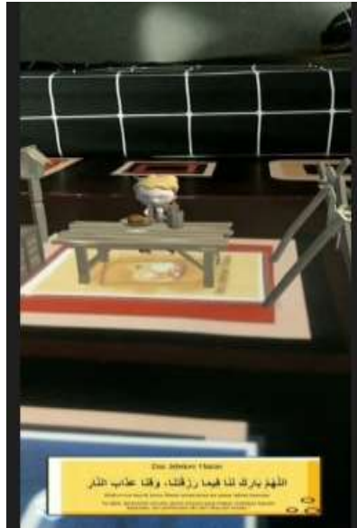
Gambar 10 Gambar 3 dimensi doa sebelum makan

Solat merupakan ibadah yang wajib dijalani oleh setiap muslim dalam pelaksanaan ibadah solat ini pun peserta didik sudah dibiasakan untuk melaksanakan solat secara tartib sesuai dengan rukun dan syarat sahnya solat, namun dalam praktiknya masih ada peserta didik yang belum sesuai dengan kaidah fiqih. Dengan adanya augmented reality ini peserta didik jadi bisa lebih memahami bagaimana solat yang benar sesuai kaidah dikarenakan teknologi ini menampilkan gambar 3 dimensi yang dapat bergerak serta bersuara. Cara pengaplikasiannya pun sama seperti sebelumnya yaitu dengan menggunakan aplikasi yang telah disediakan setelah itu scan barcode yang telah disediakan secara otomatis layar akan menampilkan gambar 3 dimensi serta audionya.