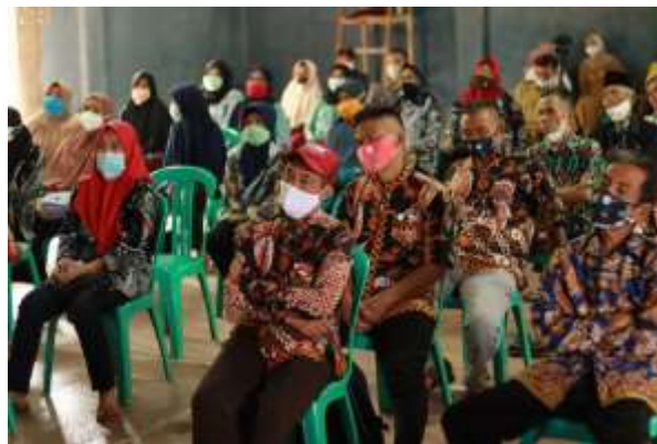
Gambar 6 (Rempug Warga di GOR desa Jatisari)

Setelah melakukan rempug warga , peneliti mengetahui masalah apa saja yang sedang dihadapi oleh masyarakat di desa Jatisari. Beberapa masalah tersebut diantaranya; kurangnya kesadaran masyarakat akan menjaga lingkungannya terutama dalam membuang sampah, kurangnya kesadaran akan pentingnya proses pembelajaran online, kurangnya variasi dalam kegiatan belajar mengajar, kurangnya kesadaran masyarakat akan pentingnya kesehatan mental serta kurangnya kesadaran masyarakat akan pentingnya teknologi juga dampak positif dari penggunaan gawai dan sosial media.