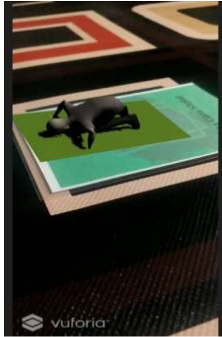
Gambar 12 Gambar 3 dimensi Tata cara solat