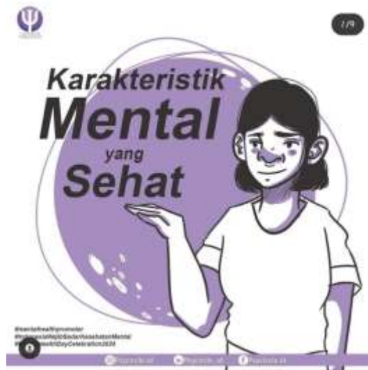
Gambar 8 Poster mengenai kesehatan mental yang dibagikan disosial media

Media sosial tentu menjadi wadah terbaik untuk menyampaikan informasi pada masa kini. Mungkin masih banyak individu yang mengabaikan tentang kesehatan mental. Mayoritas manusia hanya fokus kepada fisik dan abai terhadap mental, sehingga banyak individu yang terjangkit stress sehingga mengundang penyakit seperti stroke, hipertensi ataupun serangan jantung. Dengan demikian sangat penting memberikan edukasi tentang kesehatan mental terlebih kepada masyarakat di desa Jatisari yang masih berpegang kepada sistem berpikir tradisional.