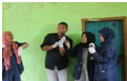
Gambar 2. Simulasi mencuci tangan yang baik dan benar

Kuman dapat berada dimana saja di telapak tangan sela-sela jari di bawah kuku dan di bagian anggota tubuh lainnya. Oleh karena itu kita harus senantiasa menjaga kebersihan, apalagi tangan merupakan anggota tubuh yang sering di gunakan. Maka dari itu kita harus mencuci tangan sesudah melakukan maupun sebelum melakukan aktifitas.