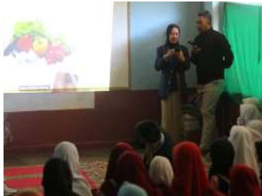
Gambar 3. Kegiatan penyuluhan PHBS

Setelah diberikan penyuluhan PHBS alhamdulillah terjadi peningkatan pola hidup sehat yang lebih baik pada warga setempat, dan juga mengajak warga untuk melakukan kebiasaan bersih-bersih dilingkungan sekitar dan membuat jadwal kerjabakti yang rutin di lakukan setiap hari jum'at setiap 1 minggu sekali. Dalam tempo 1 sampai 2 hari beerapa warga sudah terlihat mengaplikasikan ilmu atau hasil dari sosialisasi mengenai pola hidup bersih dan sehat, dengan pemberian sabun cair, sikat dan pasta gigi anak-anak pun nampak bersemangat dalam menerapkan pola hidup bersih dan sehat. Apabila dilanjutkannya pengabdian ini kami merekomendasikan pengabdian yang memfokuskan terhadap pengembangan pengetahuan terhadap anak-anak karena anak-anak dikampung Sideranglekok terbilang banyak sekali. Seperti penyuluhan hal dasar pengetahuan tentang kesehatan, membedakan jajanan yang sehat dan yang tidak sehat, mencuci tangan sebelum dan sesudah melakukan aktivitas sehari-hari dan masih banyak yang lainnya.